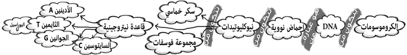
مخطط ذهني لتكوين الكروموسومات (DNA)

DNA ... أنه كتاب الارشادات الذي تصنع عن طريقة الحياة. من البكتريا والنباتات والحيوانات إلى الحيوانات إلى الانسان DNA هو سر الحياة في كل هذه الكائنات . كل الصفات التي تمثلنا مكتوبه في DNA وتسمى المحتوى الوراثي (الجينوم). هذا المحتوى ينقل من جيل الى جيل إلى اخر عن طريق التكاثر . المعلومات تخزن في DNA عن طريق اربع انواع من الجزئيات (الأدينين ، الجوانين ، السايتوسين ، الثايمين) ، هذه الجزئيات الاربعة تتجمع كزوجان معا وهناك مليارات من هذه الأزواج في DNA مرتبه بشكل (سلم ملتوي) قوي ومضغوط. الDNA يتجمع على الكروموسومات تخزن داخل نواة الخلية ، في الانسان يوجد 23 زوج من الكروموسومات . جزء من الكروموسوم يسمى (جين) والجين يحمل ارشادات تكوين البروتين المهم للحياة .