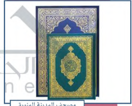
مصحف المدينة المنورة