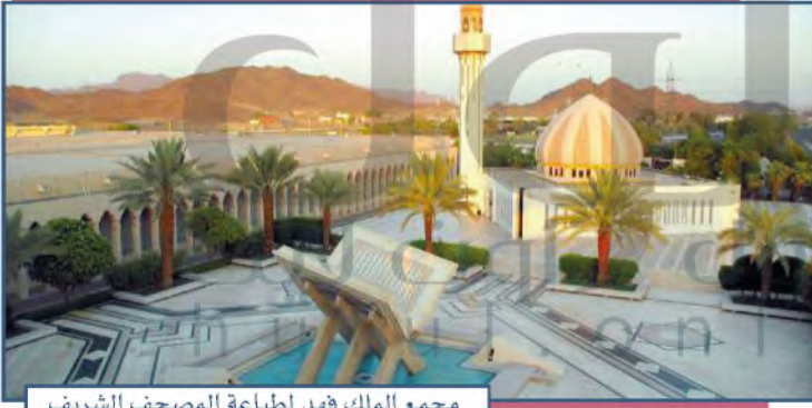
مجمع الملك فهد لطباعة المصحف الشريف

أُنشئ في وطني المملكة العربية السعودية مجمع الملك فهد لطباعة المصحف الشريف في المدينة المنورة عام ١٤٠٥هـ، ومجمع خادم الحرمين الشريفين الملك سلمان بن عبدالعزيز آل سعود للحديث النبوي الشريف في المدينة المنورة عام ١٤٣٩هـ، وترجمت معاني القرآن الكريم إلى عدد من اللغات، ووُزعت نسخ القرآن الكريم على جميع المسلمين.