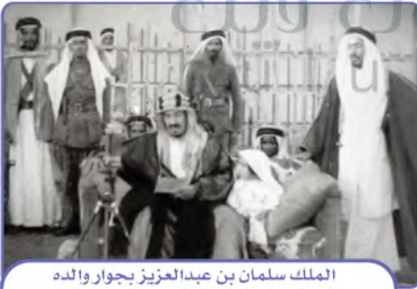
الملك سلمان بن عبدالعزيز بجوار والده الملك عبدالعزيز وعمره ستان ونصف

يقرأ الطلبة النص الآتي ثم يجيبون عن السؤال: