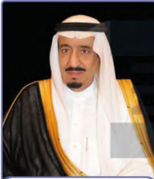
خادم الحرمين الشريفين الملك سلمان بن عبدالعزيز

خادمُ الحرمين الشريفين وملكُ المملكة العربية السعودية الملك سلمان بن عبدالعزيز بن عبدالرحمن بن فيصل بن تركي آل سعود. وُلد في مدينة الرياض عام ١٣٥٤هـ، وتربى على يد والديه تربية إسلامية عربية أصيلة، تلقى تعليمه المبكر في مدرسة الأمراء بالرياض، حيث درس العلوم الدينية والعلوم الحديثة، وختَمَ قراءة القرآن كاملاً في هذه المدرسة.