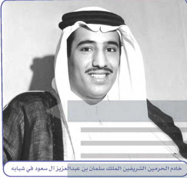
خادم الحرمين الشريفين الملك سلمان بن عبدالعزيز آل سعود في شبابه

حظي خادم الحرمين الشريفين الملك سلمان بن عبدالعزيز آل سعود بالعناية الخاصة من والده الملك عبدالعزيز، الذي أتاح له الاطلاع على ما تقوم به الحكومة من أعمال وهو في سن صغيرة.