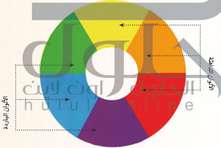
شكل (٣): الألوان الدافئة والباردة في دائرة الألوان. ▲

وتتقسم الألوان الناتجة في دائرة الألوان إلى مجموعتين: أ- مجموعة الألوان الدافئة هي: اللون الأحمر، والبرتقالي، والأصفر، شكل (٣) وسميت بالألوان الدافئة لأنها؛ تمنحنا الإحساس بالدفء، ونشاهدها في لهب النار وأشعة الشمس، وترمز للفرح، والسرور، والضياء، والنور. ب- مجموعة الألوان الباردة هي: اللون الأخضر، والأزرق، والبنفسجي، شكل (٣)، وسميت بالألوان الباردة؛ لأنها تمنحنا الإحساس بالبرودة والهدوء ونشاهدها في الزرع الأخضر، ومياه البحار، والسماء، وترمز إلى الهدوء والسلام والحكمة والاعتزان.