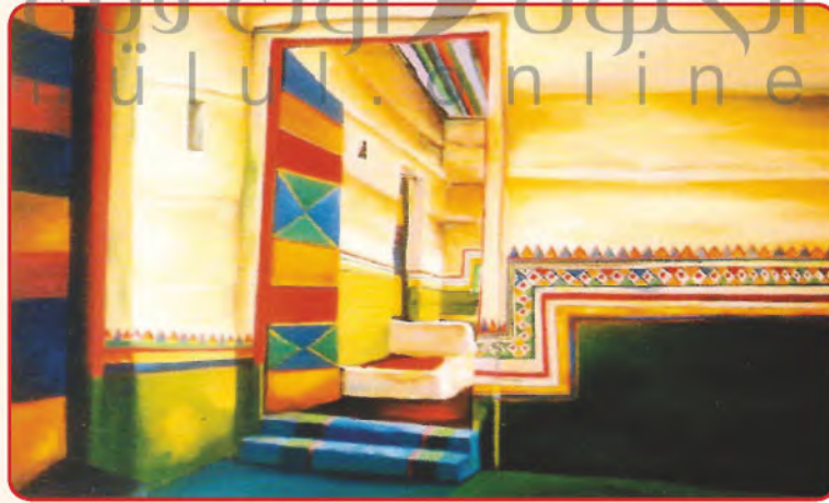
شكل (٨): لوحة للفنان السعودي فايع الألمعي.