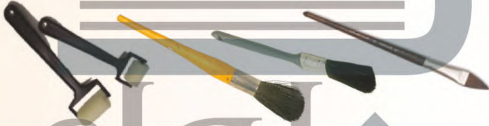
فرش خاصة بالألوان المائية حجم كبير، أو بدائل الفرش.