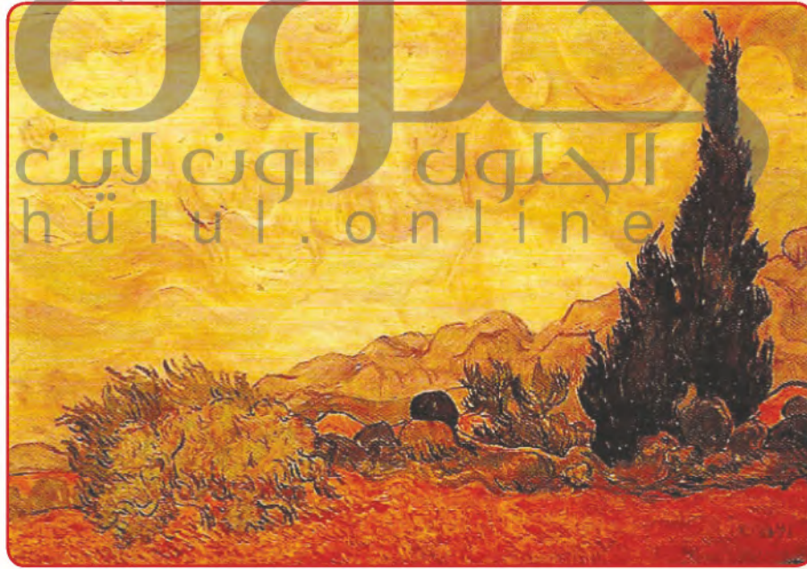
▲ شكل (٦): لوحتين للفنان فان جوخ.