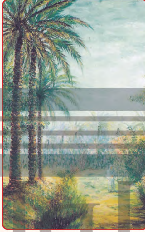
شكل (٧): لوحة للفنان السعودي منير الحججي.

وأيضًا هناك فنانون سعوديين استخدموا الألوان الدافئة والباردة ليعبروا عن مشاعرهم تجاه المجتمع، كما في الشكلين (٧، ٨).