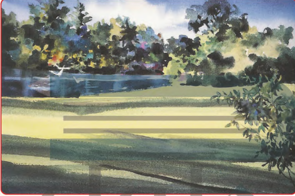
شكل (١٢): الشكل النهائي للوحة.

الخطوة الثالثة: نوزع اللون الأخضر بدرجاته الفاتحة والغامقة التي تمثل لون النباتات والأعشاب.