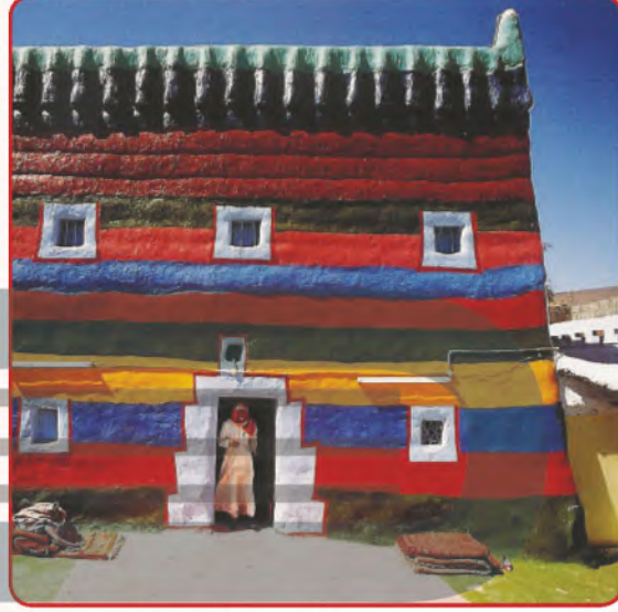
تلوين جدار المنزل من الخارج.