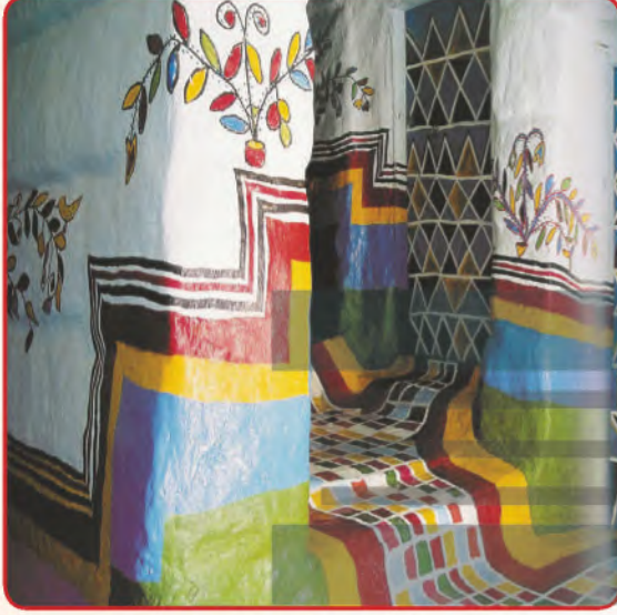
تلوين جدار المنزل من الداخل، (فن القط العسيري).

استخدم الفنان الشعبي الألوان الدافئة والباردة في تزيين أرجاء المنازل الشعبية، والحلي الشعبية المنسوجة بالخیوط، والبسط الشعبية الجميلة، شكل (٥).