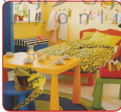
أثاث منزلنا وملابسنا.