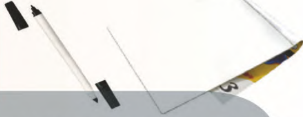
لون أسود فلوماستر.