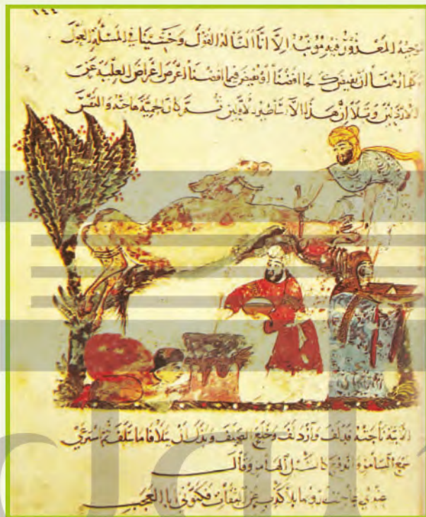
الشكل (٢)، لوحة منمنمة

في السطور الآتية اكتب وصفاً لما تراه في المنمنمة ابتداءً بالموضوع، ثم بالعناصر الشكلية من لون وخط وشكل وزخارف.