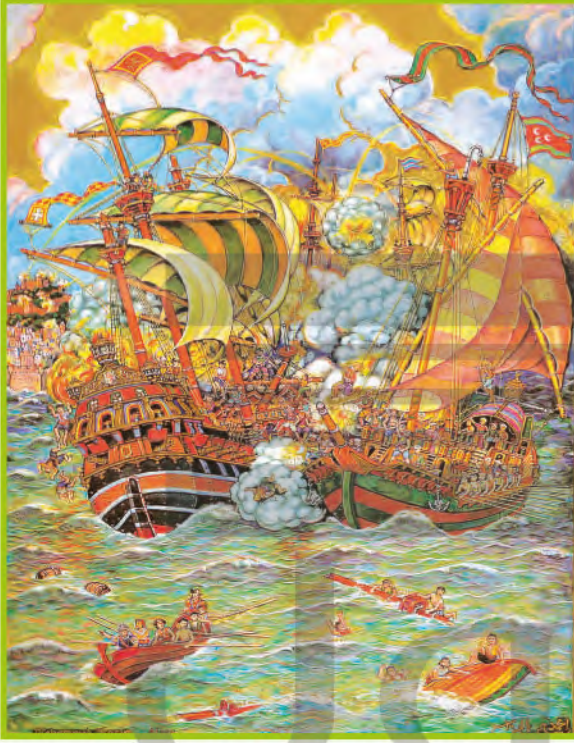
الشكل (٣)، لوحة الفنان الجزائري محمد راسم.

الشكل (٣) يمثل لوحة لمعركة بحرية قام بتنفيذها الفنان محمد راسم الجزائري مواليد ١٨٩٦ م. تأمل المنمنمة ثم اكتب عدة سطور تبين وجهة نظرك حول القيم الجمالية في المنمنمة وأوجه التشابه والاختلاف مع المنمنمات الأخرى.