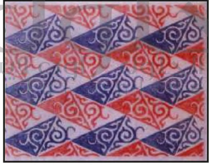
الشكل ( ٩٤ ) : لوحة للفنان العالمي ديفيد أشر.

إن استخدام الألوان في الفن الإسلامي الزخرفي يؤدي وظيفة جمالية مبهرة لعين الرائي، فلقد استخدم الفنان المسلم الألوان الساخنة والباردة بدرجات متنوعة ولم يستخدم اللون مباشرة بل مزجه بألوان أخرى ليضيف إلى معطيات اللون ثراءً، ولقد استخدمت هذه الألوان في الفنون الإسلامية كدلالات رمزية لمعاني خاصة، لذلك فإن مصدر جمال كثير من الأشياء مستمد من ألوانها. استخدمت الألوان الحمراء والصفراء واللون الذهبي بكثرة في الفنون الإسلامية المتنوعة فاللون الذهبي يعبر عن مدلول روحاني ويكون في أماكن العبادة والمساجد والألوان الحمراء والصفراء فهي من درجات الألوان الساخنة فهي تعطي إحساساً بالحركة والحيوية في العمل الفني وأما اللون الأخضر والأزرق فهما يعطيان إحساساً باللانهاية والامتداد. ولقد أثرت الموضوعات الزخرفية للفنون الإسلامية في الفن الغربي المعاصر.