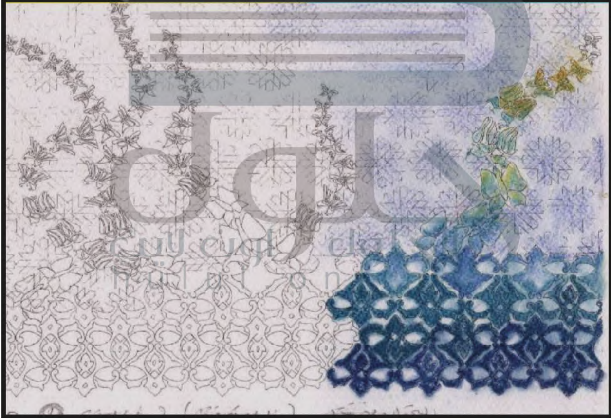
الشكل (٩٧): تصميم زخرفي.

لنتكر تصميم زخرفي لا نهائي باستخدام برامج الحاسب الآلي أو أحد برامج الأجهزة الذكية في المنزل؟