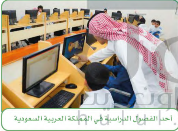
أحد الفصول الدراسية في المملكة العربية السعودية