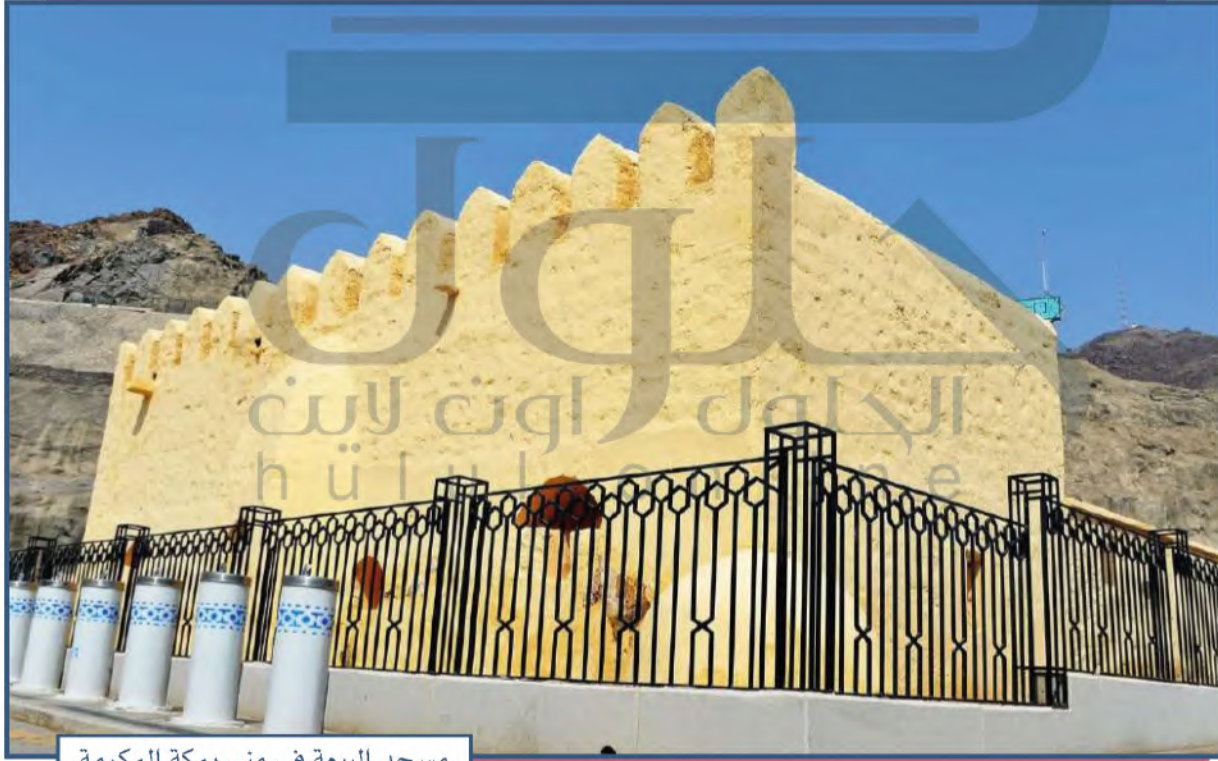
مسجد البيعة في منى بمكة المكرمة

وفي السنة التالية لبيعة العقبة الأولى، جاء إلى الحج مسلمون من أهل يثرب، وبعد وصولهم إلى مكة جرت بينهم وبين النبي محمد ﷺ اتصالات سرية أدت إلى الاتفاق على أن يجتمعوا ويباعوا الرسول ﷺ عند العقبة أيام التشريق. فاجتمع ثلاثة وسبعون رجلاً وامرأتان وبيعوا النبي ﷺ ببيعة العقبة الثانية، فطلب منهم النبي ﷺ أن يختاروا اثني عشر رجلاً يكونون نُبأ، يتحملون المسؤولية عنهم في تنفيذ هذه البيعة.