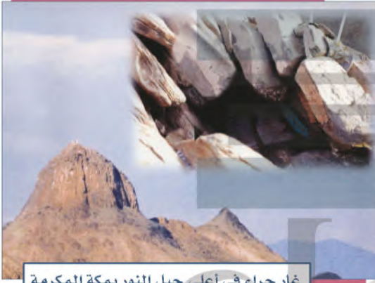
غار حراء في أعلى جبل النور بمكة المكرمة

بدأت بوادر الوحي على النبي محمد ﷺ بالرؤيا الصادقة، فكان لا يرى رؤيا في منامه إلا جاءت مثل فلق الصبح (أي: نور الصبح)، ثم حُبِبَتْ إليه الخلوة بنفسه والتعب، والتوجه إلى الله، فاتخذ من غار حراء في جبل النور مكاناً له يتعبد فيه، وعندما بلغ الأربعين من عمره نزل عليه الوحي.