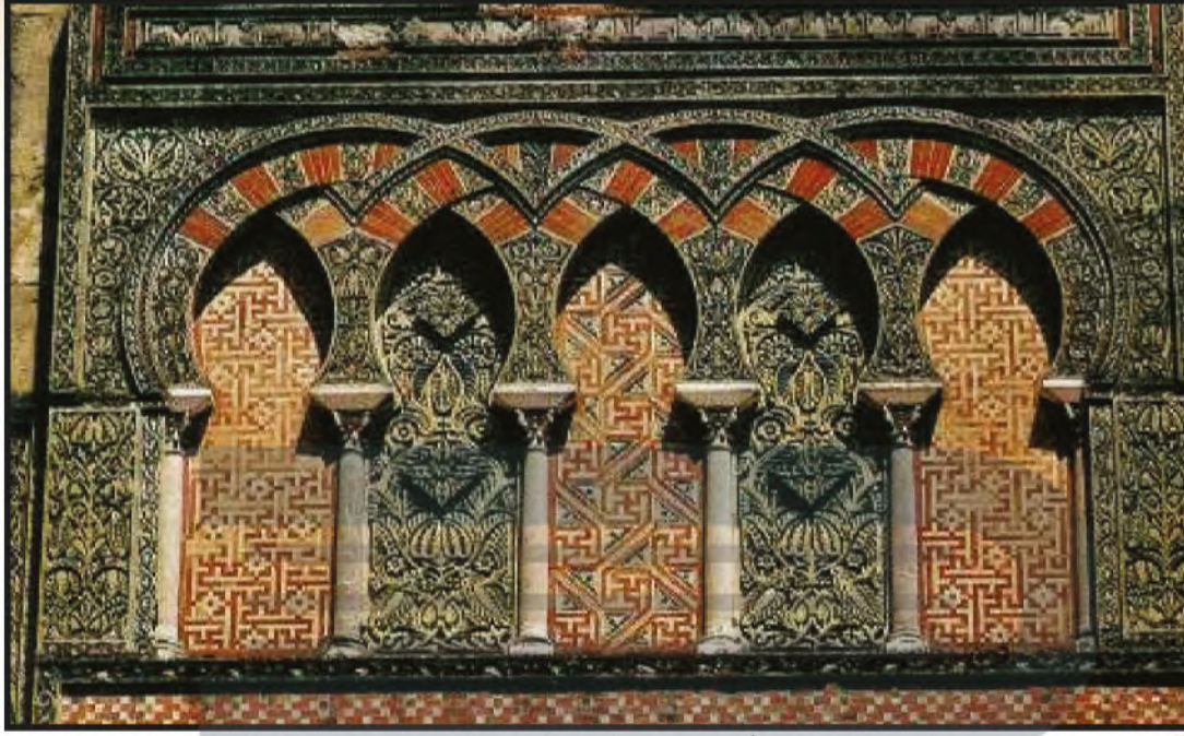
الشكل ( ٨٤ ) جزء من واجهة المسجد الكبير في قرطبة ( العصر الأموي ) وهو مزخرف بزخارف هندسية ونباتية تتصف بالاستمرارية والانهائية .