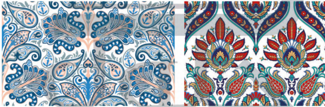
الشكل (٨٢) : التكرار المتناوب أو المتبادل .

لذلك كانت خاصية التكرار في الفن الإسلامي من الابتكارات الفنية التي استطاع الفنان المسلم أن يوظفها توظيفاً جمالياً مبتكراً في كافة المجالات، بعيداً عن الملل والرتابة، وهو من الخصائص البارزة للزخارف الإسلامية على اختلاف أنواعها، ويأخذ اتجاهات متنوعة مائلة وممتدة ومتساقطة وأفقية ودائرية .