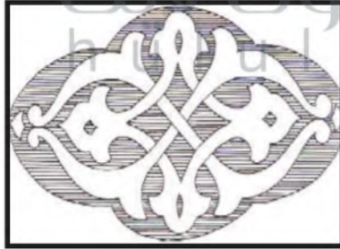
الشكل (٩١) .