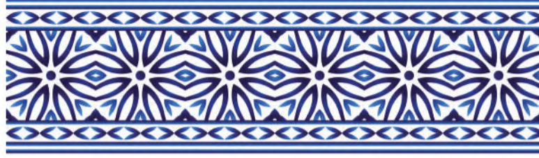
الشكل ( ٨١ ) : التكرار التقليدي المنتظم .

اعتمد الفن الاسلامي على قيم غنية وجمالية رفيعة كالتكرار والامتداد والاستمرارية إلى ما لا نهاية