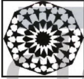
الشكل (٨٩) .