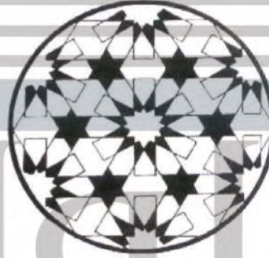
الشكل (٨٦): وحدة زخرفية هندسية.

ب- ما هو العنصر الزخرفي المستخدم في هذا التصميم؟ العنصر المستخدم هو النجمة الإسلامية