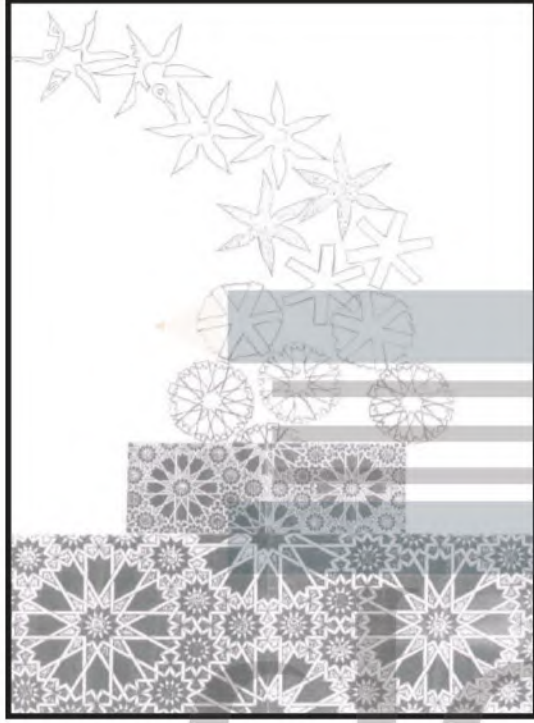
الشكل (٩٣): تصميم زخرفي .