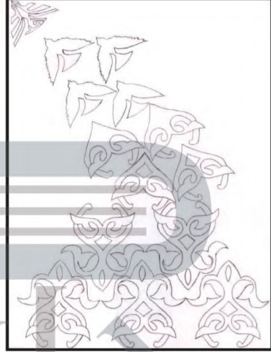
الشكل (٩٢): تصميم زخرفي .