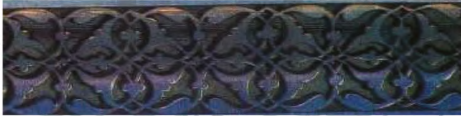
الشكل ( ٨٥ ) : زخارف نباتية لانهائية .