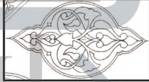
الشكل (٨٨) .