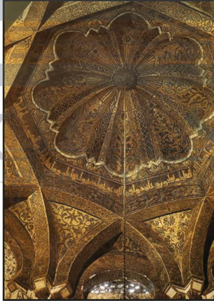
الشكل ( ٨٠ ) : قبة من داخل جامع قرطبة في الأندلس تتجلى فيها دقة الزخرفة الإسلامية وروعها .

الفن الإسلامي معين لا ينضب، فهو غني بمصادره التي قام عليها؛ لأنه قابل للتطور والتحديث ينهل منه الفنانون المعاصرون لإنتاج أعمال فنية حديثة، تتميز بروح العصر وأصالة الماضي . وهو من الفنون الغنية بالقيم الفنية والجمالية الرفيعة كالتكرار والامتداد والاستمرارية إلى ما لا نهاية .