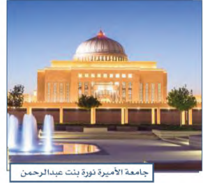
جامعة الأميرة نورة بنت عبدالرحمن