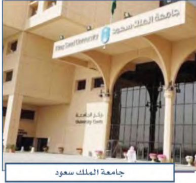
جامعة الملك سعود