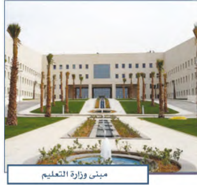
مبنى وزارة التعليم