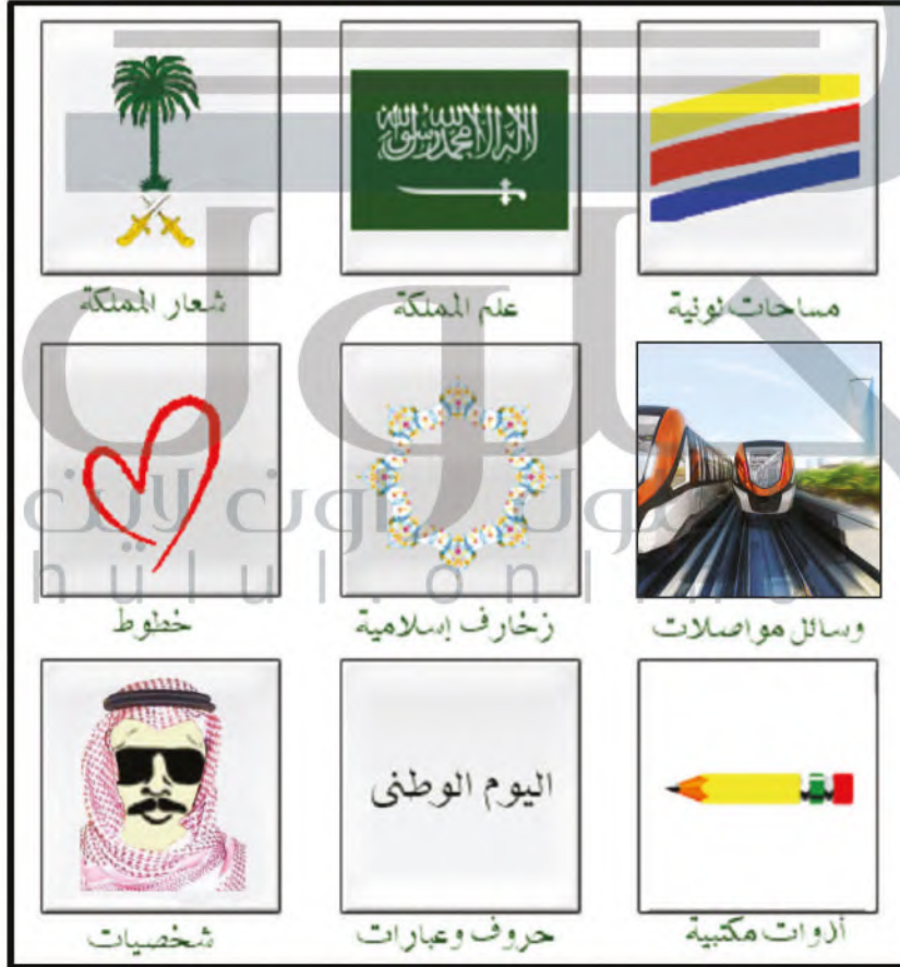
الشكل (٣٥) شعارات متنوعة .