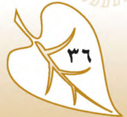
الشكل (٤١): شعار الجمعية العربية السعودية للثقافة والفنون.

الجمعية العربية السعودية للثقافة والفنون