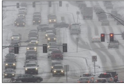
العاصفة ( ----- )