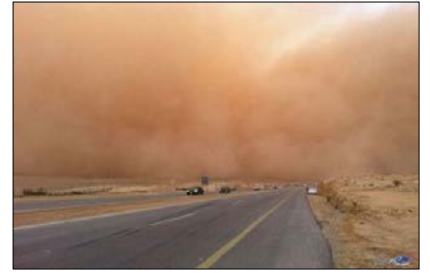
العاصفة ( ----- )