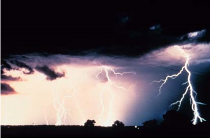
العاصفة ( ----- )

من خلال الصور الموضحة أمامك اذكر نوع العاصفة: