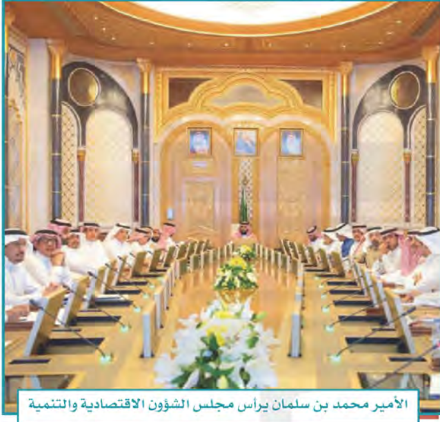
الأمير محمد بن سلمان يرأس مجلس الشؤون الاقتصادية والتنمية