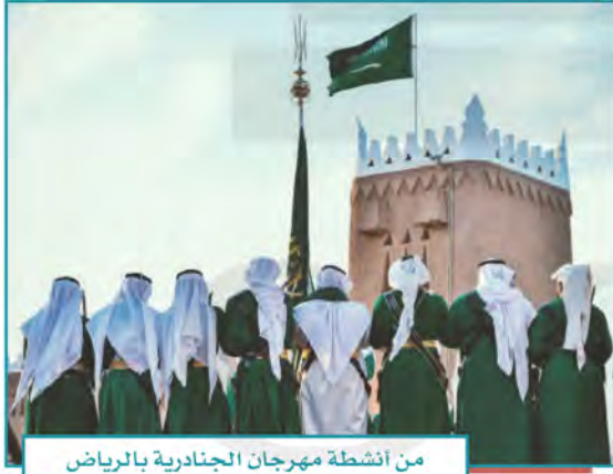
من أنشطة مهرجان الجنادرية بالرياض

يتضمن استثمار الإمكانات السياحية والثقافية والتراثية والتاريخية الغنية في المملكة العربية السعودية، وهو قطاع واعد، وتتخذ الحكومة عدداً من السياسات لدعمه وتوفير فرص عمل واسعة للمواطنين.