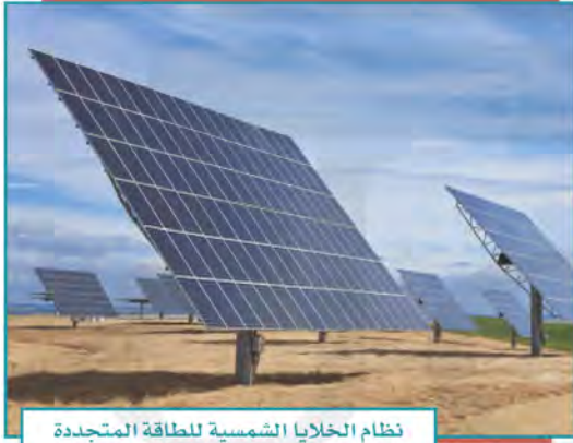
نظام الخلايا الشمسية للطاقة المتجددة

يتوزع هذا القطاع على عدد من المجالات، مثل: النفط والطاقة المتجددة والغاز، وبدأت المملكة العربية السعودية في استثمار الإمكانات الإنتاجية في قطاع الطاقة المتجددة، مثل: مشروع الطاقة الشمسية. قطاع الصناعات التحويلية: