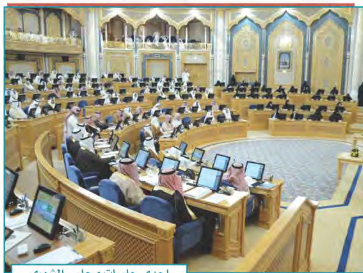
إحدى جلسات مجلس الشورى

الأغلبية: حصول القرار على أصوات نصف عدد الأعضاء + ١ (صوت واحد).