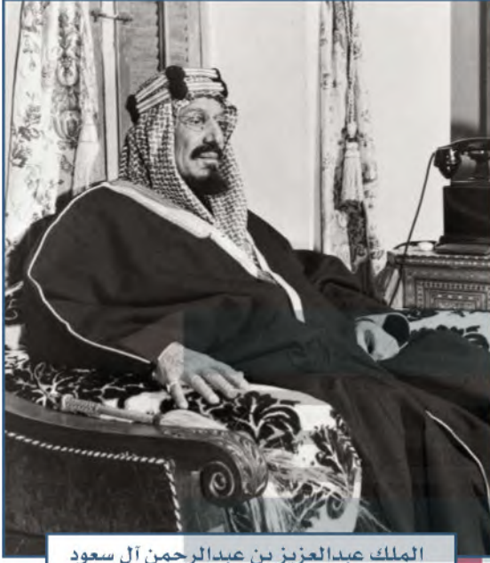
الملك عبدالعزيز بن عبدالرحمن آل سعود

وتعدّ مدن ووطننا المملكة العربية السعودية أكثر مدن العالم أمناً، إذ تتقلص فيها نسب الجريمة والمخدرات، وذلك بسبب وعي مجتمعنا وتعاونه مع سلطات الدولة. ومنذ أن وحد الملك عبدالعزيز - طيب الله ثراه - كيان هذه البلاد إلى يومنا هذا بقيادة خادم الحرمين الشريفين الملك سلمان بن عبدالعزيز آل سعود وولي عهده صاحب السمو الملكي الأمير محمد بن سلمان بن عبدالعزيز آل سعود - وفقهم الله جميعاً - يعيش بلدنا بأمن وطمأنينة.