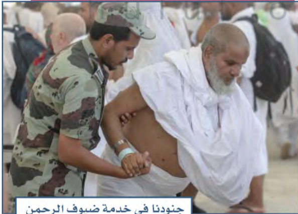
جنودنا في خدمة ضيوف الرحمن

الأمن الوطني في المملكة العربية السعودية يشمل الجانب الداخلي، وأي مهددات من الجانب الخارجي، فوطننا مستهدف من الأعداء، ولهذا يجب علينا حمايته من الداخل والخارج.