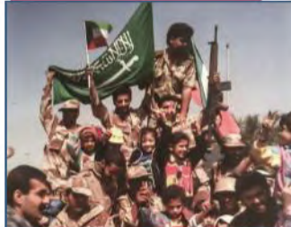
الحرس الوطني السعودي في أثناء تحرير دولة الكويت من العدوان الغاشم عام ١٤١١هـ

شاركت وحدات وزارة الحرس الوطني مع القوات المسلحة بوزارة الدفاع في حرب تحرير الكويت عام ١٤١١هـ، وقدم جنودنا البواسل أروع صور الفداء والشجاعة.