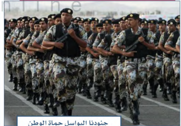
جنودنا البواسل حماة الوطن