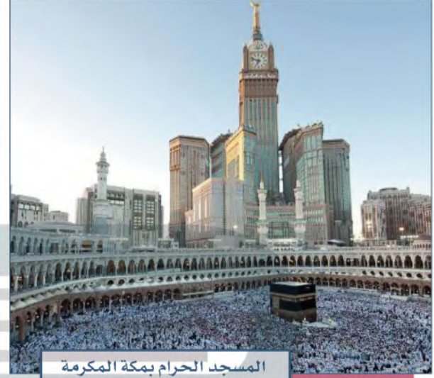
المسجد الحرام بمكة المكرمة