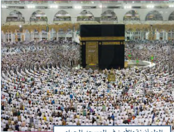
الطمأنينة والأمن في المسجد الحرام

الأمن الوطني هو الخطط والإجراءات والأعمال التي تتخذها الدولة لتحقيق الاستقرار السياسي والاقتصادي والاجتماعي لأفراد المجتمع ومؤسساته وأراضي الوطن، وللدفاع عن مصالحها الحيوية الداخلية والخارجية من أي عدوان خارجي، أو تهديد داخلي. تتبع دولتنا سياسة متوازنة تمنع التفرق، وتحث على الوحدة، وقوة الولاء للوطن والقيادة على أسس الإسلام.