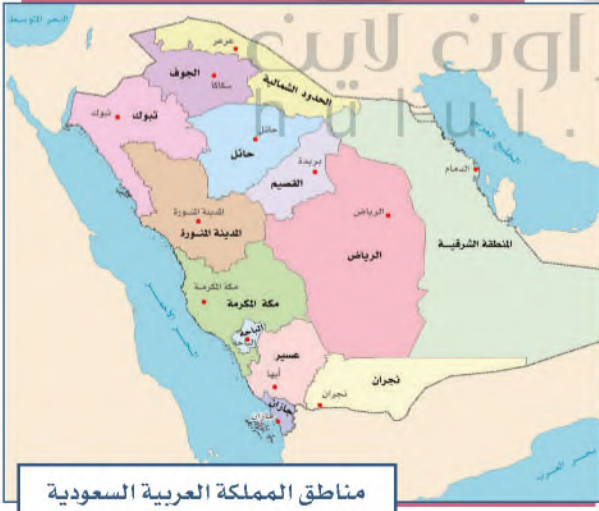
مناطق المملكة العربية السعودية