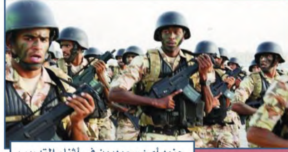
جنود أمن سعوديون في أثناء التدريب