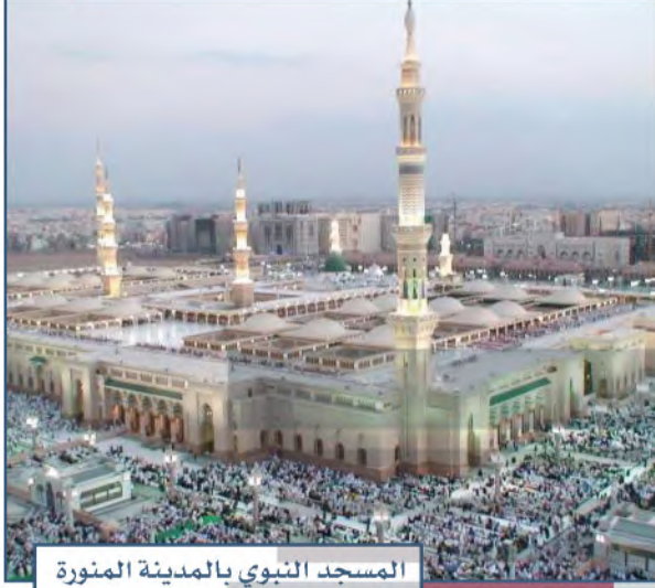
المسجد النبوي بالمدينة المنورة