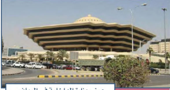
مبنى وزارة الداخلية في الرياض