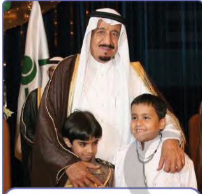
عنايته بأبناء الوطن الصغار

اعتنى بالمجتمع السعودي، وحرص على مقابلة المواطنين والسؤال عن أحوالهم، ويتفاجأ الناس عندما يعرض لهم تاريخ أسرهم وأماكنهم أكثر مما يعرفون عن أنفسهم، كما كان يزور العلماء والأعيان، ويحضر مناسباتهم الخاصة.