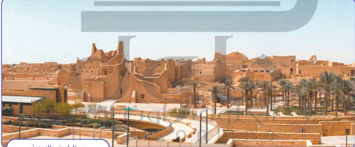
حي الطريف بالدرعية