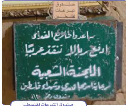
صندوق التبرعات لفلسطين

واصل خادم الحرمين الشريفين الملك سلمان بن عبدالعزيز تنفيذ سياسة المملكة العربية السعودية الداعمة للموقف الفلسطيني والوقوف مع شعبه وحكومته، وتسخير جميع الإمكانيات المادية والسياسية وغيرها لتحقيق ذلك. وأسهم خادم الحرمين الشريفين الملك سلمان بن عبدالعزيز شخصياً منذ وقت مبكر في إعداد برنامج وطني وتنفيذه تحت شعار (ادفع ريالاً تُنقذُ عربياً) لمساعدة الفلسطينيين، وكان من البرامج المؤثرة والنافعة.