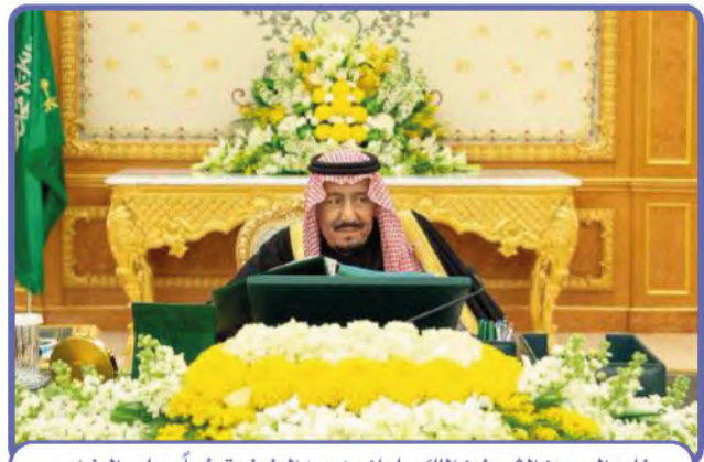
خادم الحرمين الشريفين الملك سلمان بن عبدالعزيز مترئساً لمجلس الوزراء

قال خادم الحرمين الشريفين الملك سلمان بن عبدالعزيز في كلمته للشعب السعودي عندما تولى الحكم: «سنظل بحول الله وقوته متمسكين بالنهج القويم الذي سارت عليه هذه الدولة منذ تأسيسها على يد الملك المؤسس عبدالعزيز وأبنائه من بعده».