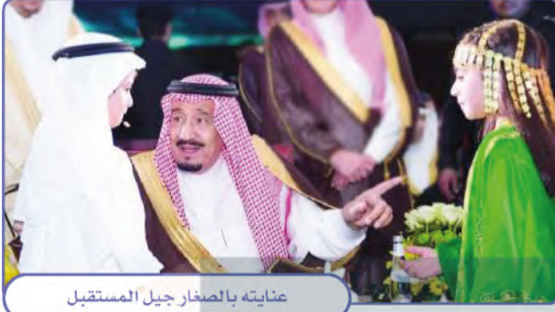
عنايته بالصغار جيل المستقبل

يدعم خادم الحرمين الشريفين الملك سلمان بن عبدالعزيز أعمال الخير، فقد ساعد على جمع التبرعات لمنكوبي السويس عام ١٣٧٥هـ، وساعد أُسر شهداء الأردن في عام ١٣٨٧هـ، وساعد الفلسطينيين وأُسْرهم، وساند منكوبي الزلازل في دول العالم ومن ضمنها باكستان، ومنتزري السيول في السودان، والمسلمين في البوسنة والهرسك والصومال وبنجلاديش وغيرها، بالدعم والإغاثة.