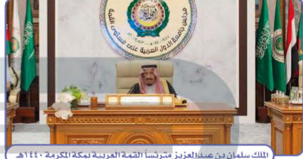
الملك سلمان بن عبدالعزيز مترئساً القمة العربية بمكة المكرمة ١٤٤٠هـ.