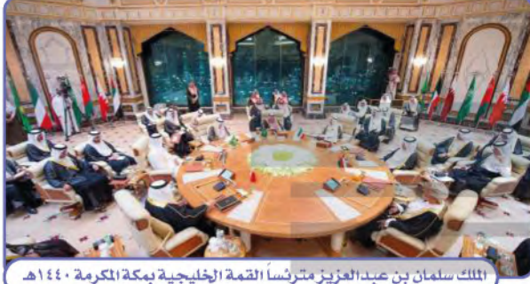
الملك سلمان بن عبدالعزيز مترئساً القمة الخليجية بمكة المكرمة ١٤٤٠هـ.

اتخذ خادم الحرمين الشريفين الملك سلمان بن عبدالعزيز العديد من القرارات لدعم الدول العربية ومساندة قضاياها؛ للمحافظة على النظام الإقليمي العربي، وتطوير الجامعة العربية بوصف المملكة العربية السعودية المحور الأساس للعرب.