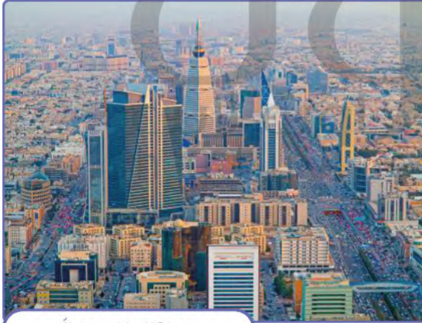
مدينة الرياض حديثاً