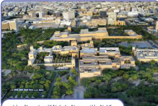
مركز الملك عبدالعزيز التاريخي بالرياض

يعتني خادم الحرمين الشريفين الملك سلمان بن عبدالعزيز آل سعود بالتاريخ الوطني؛ لأنه ذاكرة الوطن، ومنه يستلهم المواطن الفخر والاعتزاز، ومن الأمثلة على ذلك أنه يشجع الدراسات التاريخية الوطنية ويعتني بمؤسساتها، ويحرص على العناية بالتراث الوطني.