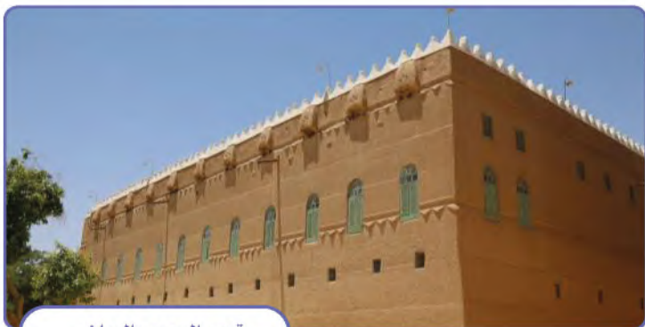
قصر المربع بالرياض