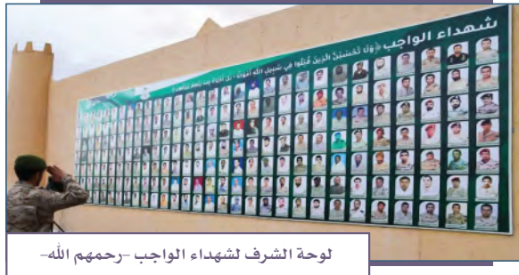
لوحة الشرف لشهداء الواجب -رحمهم الله-

◆ الوفاء لشهداء الواجب ولجنودنا البواسل الذين يحمون حدود وطننا، ويسهرون على أمنه واستقراره.