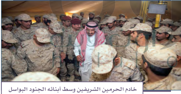
خادم الحرمين الشريفين وسط أبنائه الجنود البواسل

اليوم الوطني مناسبة يشترك فيها المواطنون، والمقيمون، والأجهزة الحكومية، والقطاع الخاص، وتتنوع الفعاليات من حيث المضمون والمكان، وهي فرصة ليشارك الجميع فيها، وهناك أسباب كثيرة تدعونا للاحتفال باليوم الوطني، منها: