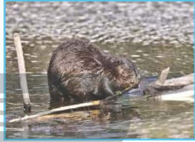
يَقْطَعُ القُدْسُ الأشْجَارَ