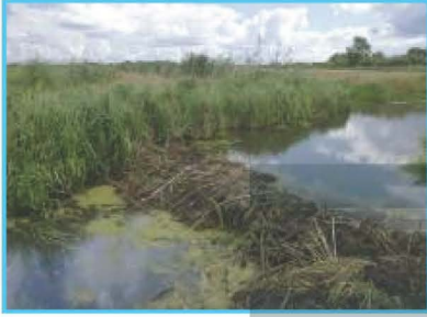
القُدْسُ يَبْنِي السَّدَّ