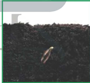
أنا زرعت بذرة