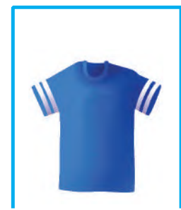
تيشرت أزرق كبير