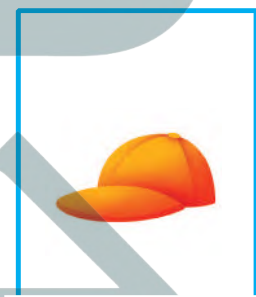
كاب برتقالي صغير