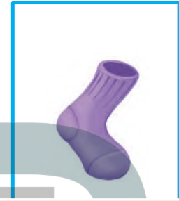
حذاء بنفسجي صغير