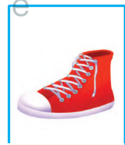
حذاء أحمر كبير