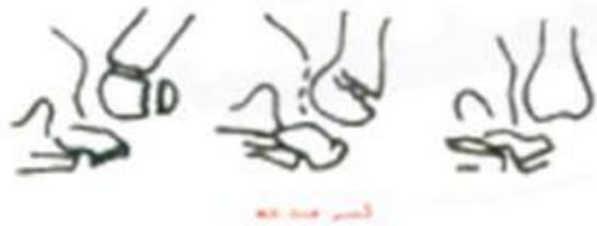
الشكل (٩-٣) أشكال الكسور