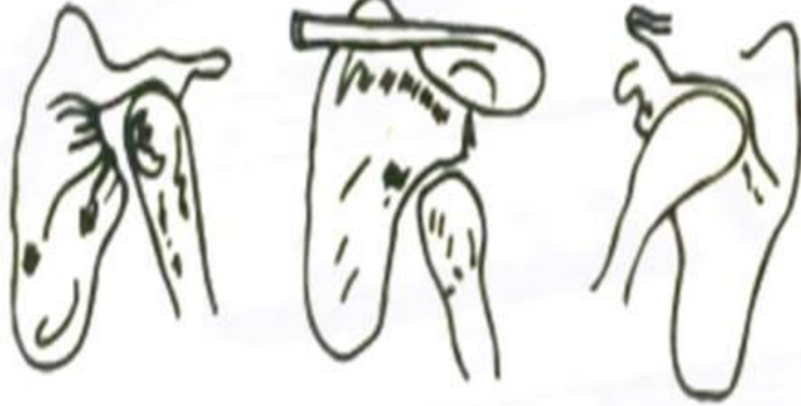
الشكل (٢-٨) خلع في مفصل الكتف

يجب تثبيت المفصل المخلوع مع وضع وسادة حتى لا تتصادم عظمتا المفصل، ويسمح له بالنقل بأقل ألم ممكن، مع مراعاة أن يتم ردّ الخلع إلى مكانه بواسطة أفراد متخصصين.