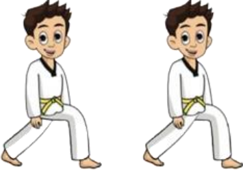
٥ - دسمة (أب - كوبي) من التحرك للأمام (بالرجل اليسرى واليمين)