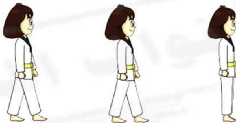
وقفة المشي (أب - سوجي) من التحرك للخلف (بالرجل اليسرى واليمنى)

٦. وقفة المشي (أب - سوجي) من التحرك للخلف (بالرجل اليسرى واليمنى) يتم اتباع نفس الخطوات الفنية في أداء وقفة المشي (أب - سوجي) من التحرك للخلف (بالرجل اليسرى) ومن التحرك للخلف (بالرجل اليمنى) التي سبق تعليمها، على أن يقوم الطالب بتحريك الرجل اليسرى للخلف يليها مباشرة تحريك الرجل اليمنى.