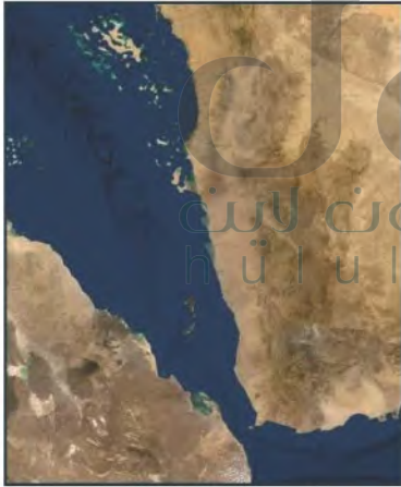
مرئية فضائية لمضيق باب المنديب