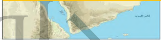
شبه الجزيرة العربية (مطبعة)

المناخ الصحراوي: مناخ قاري (حار جاف صيفاً، بارد ونادر المطر شتاءً، وتعتظم فيه الفروق بين درجة حرارة الصيف والشتاء والليل والنهار).