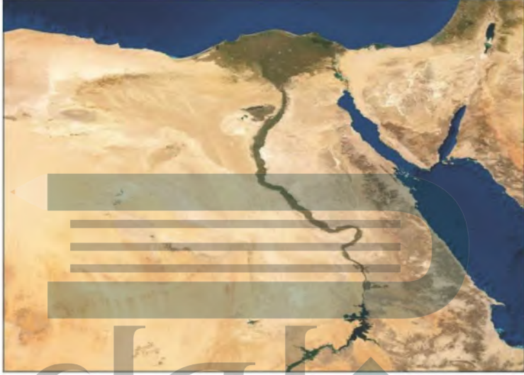
▲ مرئية فضائية لنهر النيل