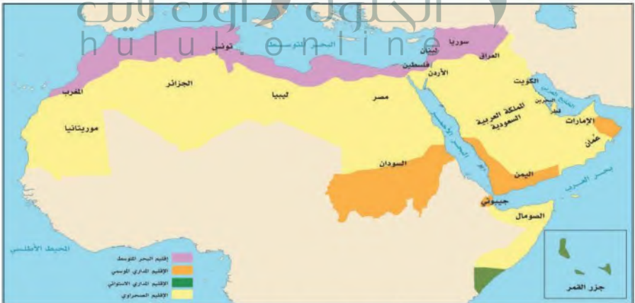
الأقاليم المناخية في العالم العربي