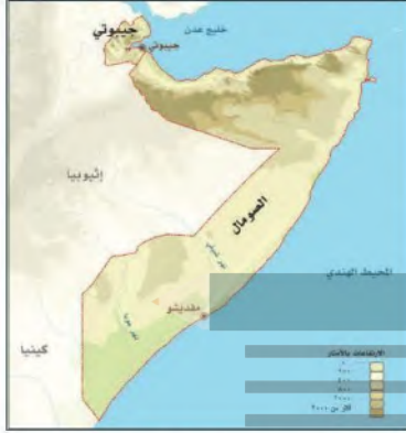
خرطة طبوغرافية لإقليم القرن الإفريقي

٣ - المناخ المداري المطير: ويظهر في جنوبي الصومال.