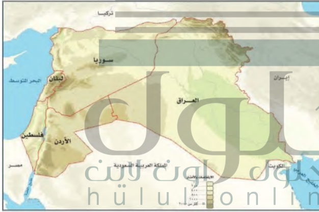
▲ بلاد الشام ورافدين