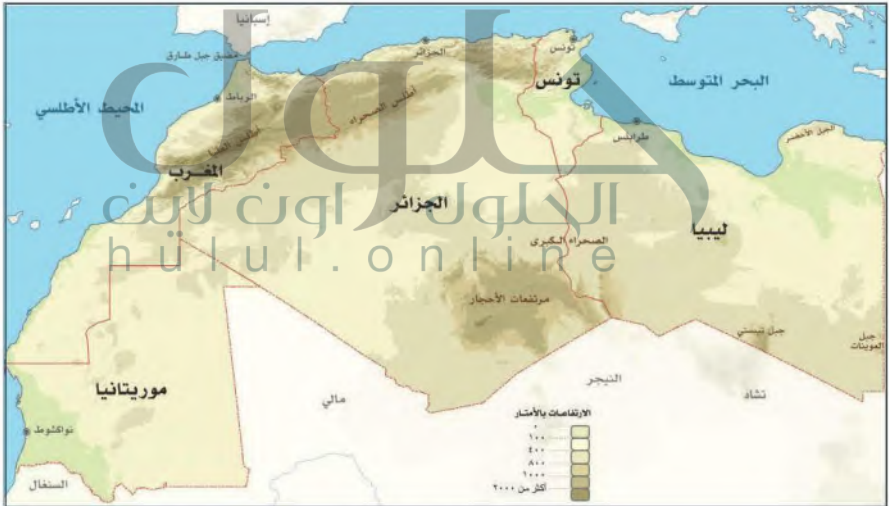
المغرب العربي (طبيعية) ▲

العالم العربي، كما انها تسرف على مضيق جبل طارق.