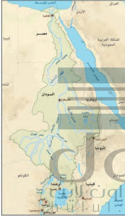
حوض نهر النيل