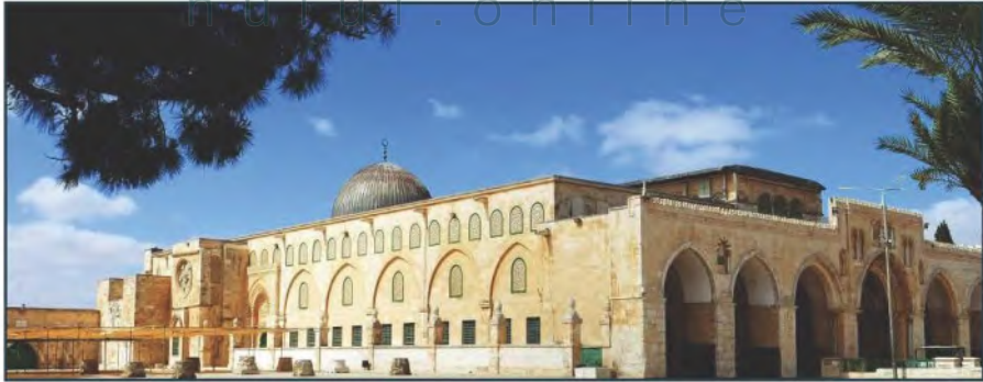
المسجد الأقصى المبارك

صَفَد، والناصرة، ونابلس، ورام الله، والقدس، وبيت لحم، والخليل.