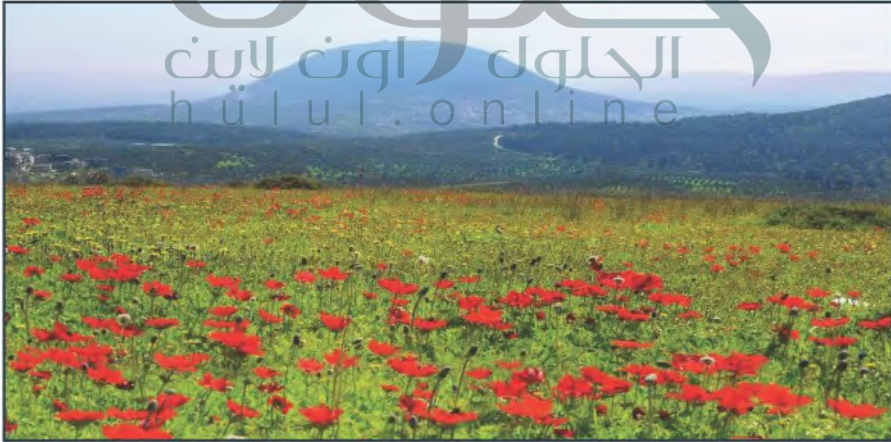
▲ جمال الطبيعة في هاسطرن

يسود المناخ شبه الصحراوي في منطقة الأغوار أخفض من الحرارة فيها صيفاً، فتصل القصوى إلى ٤٩ م في أشهر الصيف، وت يجعلها منطقة استجمام شتوية، وتسقط الأمطار شتاءً، وتحجز ساء الغربية المحملة بالأمطار من الوصول إلى هذه المنطقة، ويكون معدلها في الشمال أكبر منه في الجنوب، لذلك لا يتعدى معدل سقوط المطر على شاطئ البحر الميت ١٠٠ ملم.