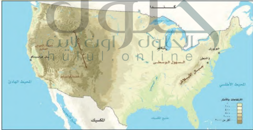
الخريطة الطبيعية للولايات المتحدة الأمريكية

وهي بهذا الامتداد تشكل القسم الأكبر من قارة أمريكا الشمالية. وتتكون الولايات المتحدة من خمسين ولاية، تمثل الكتلة المتماسكة ٤٨ منها، أما ولاية هاواي في المحيط الهادئ أصغر الولايات مساحة وولاية أسكا في أقصى شمال القارة (أكبر الولايات مساحة) فهما ولايتان منفصلتان عن جملة الولايات المتصلة. تُعد الولايات المتحدة الأمريكية مثلاً للتنوع العرقي والثقافي مع الولايات المتحدة الأمريكية ليس مثالياً، ويقال من أثر ذلك شبكة المواصلات كان لها الأثر الكبير في ترابط أجزاء الدولة مع عظم مساحتها. وتأتي الولايات المتحدة في المركز الثالث من حيث المساحة (٩,٨) أدى إلى تنوع المناخ والتضاريس فيها.