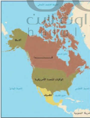
الخرائط السياسية لأمريكا الشمالية

تطل الولايات المتحدة من جهة الشرق والغرب على محيطين يشكلان طرقاتاً للاتصال والنقل مع العالم الخارجي، وتمتد بين درجتي العرض ٢٥ شمالاً عند أقصى الطرف الجنوبي لشبه جزيرة فلوريدا، و ٤٩ شمالاً التي تتخذ حداً سياسياً فاصلاً بين الولايات المتحدة الأمريكية وكندا.