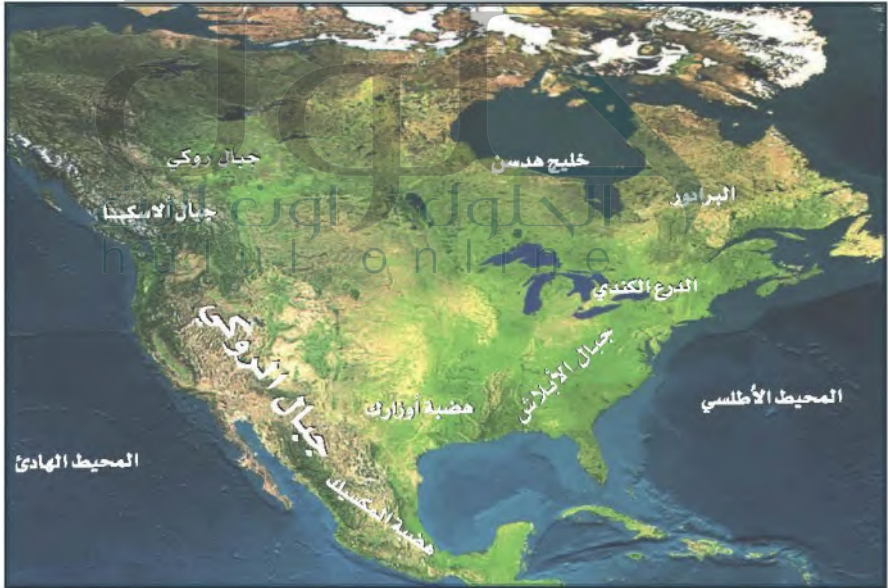
تنوع تضاريس الولايات المتحدة الأمريكية