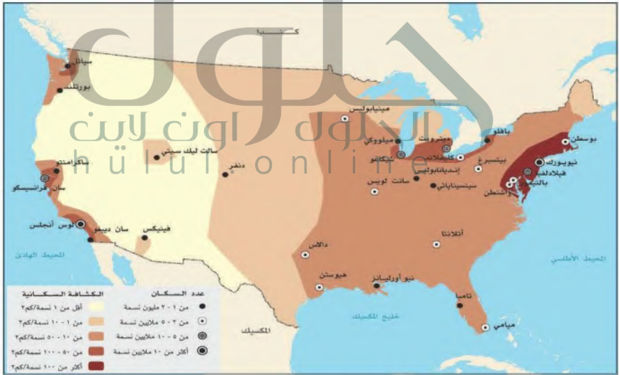
السكان في الولايات المتحدة الأمريكية

وتتفاوت الكثافة السكانية من ولاية إلى أخرى بحسب نشوء المراكز العمرانية وتوافر الخدمات، وتبلغ الكثافة ذروتها في الجزء الشمالي الشرقي من الدولة. ويسكن نحو ٨٢٪ من الأميركيين في المناطق الحضرية، وهناك عشر مدن مليونية يعيش فيها أكثر من خمسة ملايين نسمة، هي: (نيويورك، ولوس أنجلوس، وشيكاغو، ودالاس، والعاصمة واشنطن)، وفيها اثنتان وخمسون منطقة حضرية ذات تعداد سكاني يتجاوز حاجز المليون نسمة. ويعد النمو السكاني في الولايات المتحدة بطيئاً، حيث تبلغ نسبته أقل من ١٪ لعام ٢٠١٧م، ويبلغ معدل المواليد فيها ١٢ مولوداً لكل ألف من السكان لعام ٢٠١٦م، أما معدل الوفيات فيها فيبلغ ٨ لكل ألف من السكان للعام نفسه، ويبلغ متوسط العمر المأمول للحياة أكثر من ٧٩ سنة للفرد، والإناث أطول عمراً من الذكور، وترتيبها في ذلك هو المركز التاسع والأربعون بين دول العالم، حيث يعد نظام الرعاية الصحية فيها أفضل من أي دولة أخرى، وقد وضعتها منظمة الصحة العالمية في المرتبة الأولى؛ للتقدم الطبي فيها.