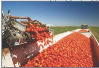
جني الطماطم في كاليفورنيا

ولذا تتنوع الموارد الاقتصادية، كالثروة الزراعية بشقيها النباتي والحيواني، حيث تأتي الزراعة فيها في المركز الأول في العالم، وتنتج المحصولات بأنواعها، وخصوصاً الفواكه والحبوب، كما ترعى الماشية والأغنام والماعز.