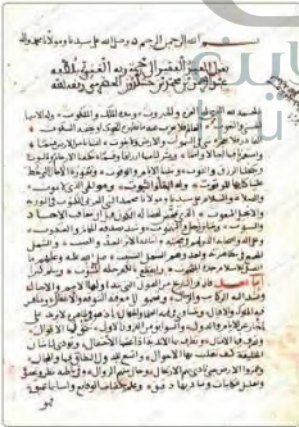
نسخة من مخطوطة تاريخ ابن خلدون (العبر وديوان المبتدأ والخبر)

انتقل عبدالرحمن بن خلدون من مؤرخ إلى مفسر للتاريخ يتأمل الدورات الحضارية المتعاقبة فيرصد مظاهرها، وينظر في أسباب نشأتها وعوامل فنائها، ووضع نظريته في العمران البشري والاجتماع الإنساني ودونها في مقدمته الشهيرة لكتابه (العبر وديوان المبتدأ والخبر في أيام العرب والعجم والبربر ومن عاصرهم من ذوي السلطان الأكبر).