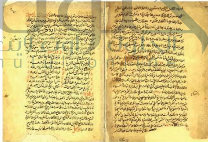
(نسخة مخطوطة محفوظة بمبادرة الملك عبدالعزيز)

للمؤرخ عثمان بن بشر عدد من المؤلفات الأخرى، منها كتاب في علوم الفلك بعنوان (الإشارة إلى معرفة منازل السبعة السيارة) ألفه بطلب من الإمام فيصل بن تركي في الدولة السعودية الثانية.