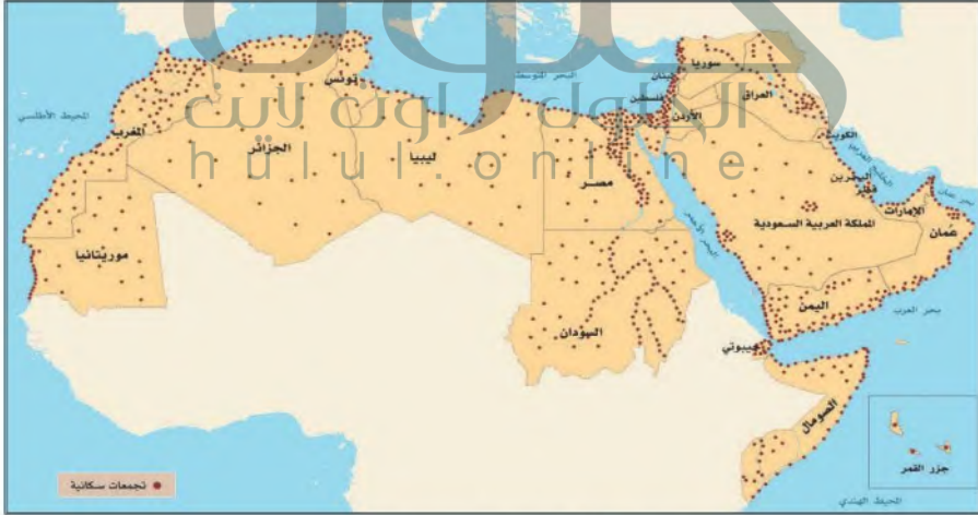
توزيع السكان في العالم العربي

أقاليم ذات كثافة سكانية منخفضة جداً: وتشمل صحراء الربع الخالي وبعض مناطق الصحراء الكبرى، حيث تكون الكثافة السكانية فيها نسمة واحدة/كم ٢ .