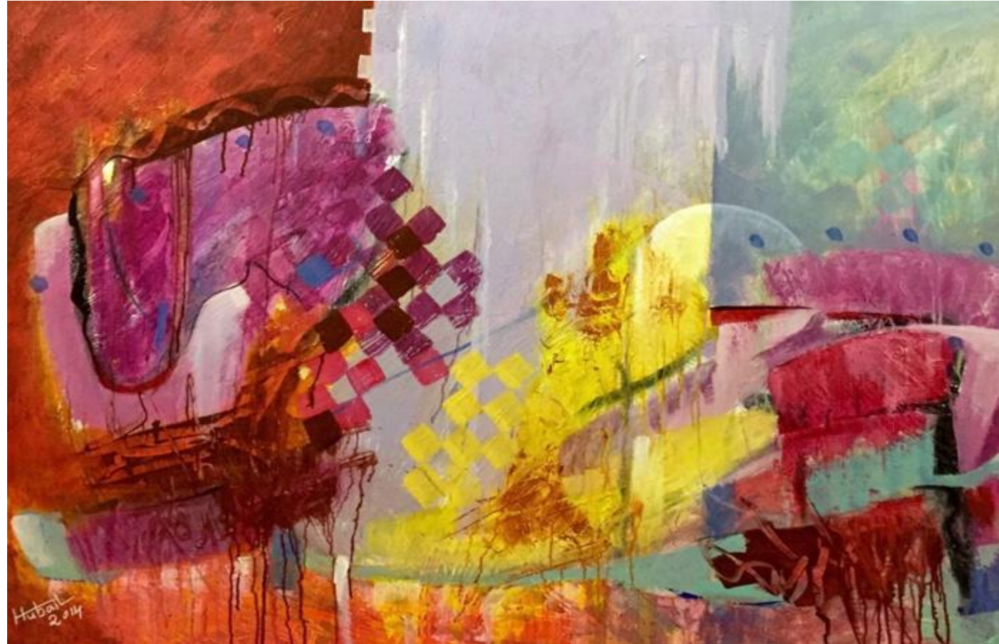
لوحة الفنان السعودي حسين الحبيب