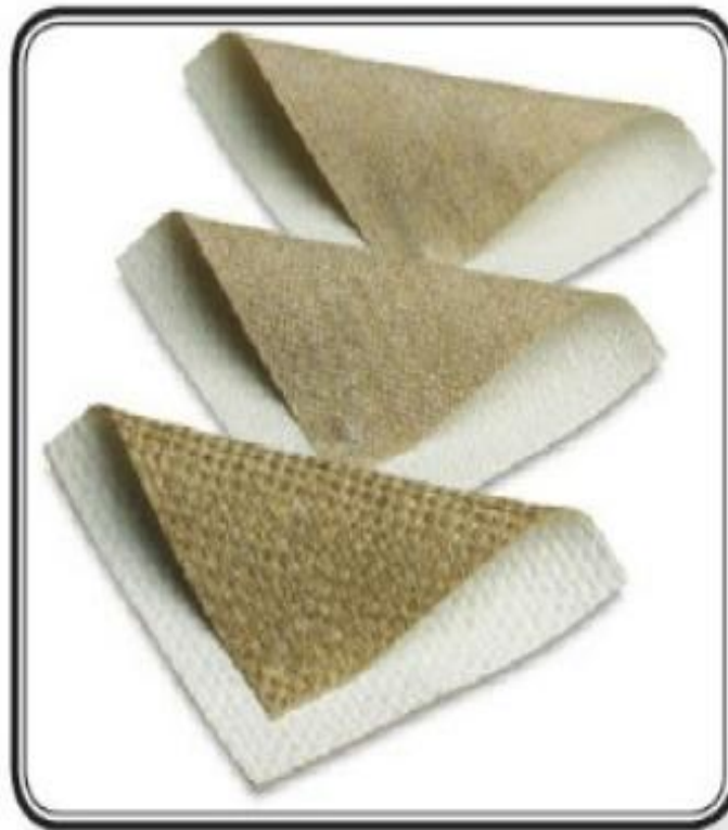
الشكل (١٦): أنواع مختلفة ومتعددة من قماش الكانفيس.