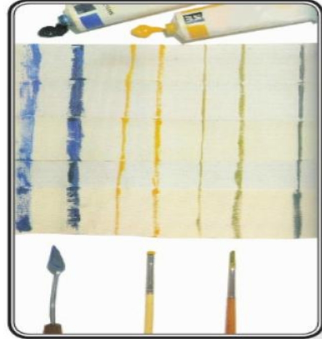
الشكل (٢٥): أنواع مختلفة من فرش الرسم الزيتي، على أنواع مختلفة من قماش الكانفاس.