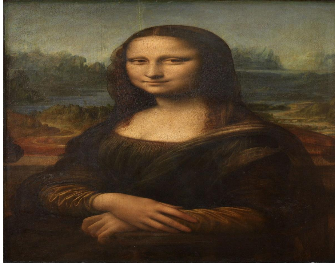
لوحة الموناليزا (الجاكوندا) للفنان (ليوناردو دافنشي)