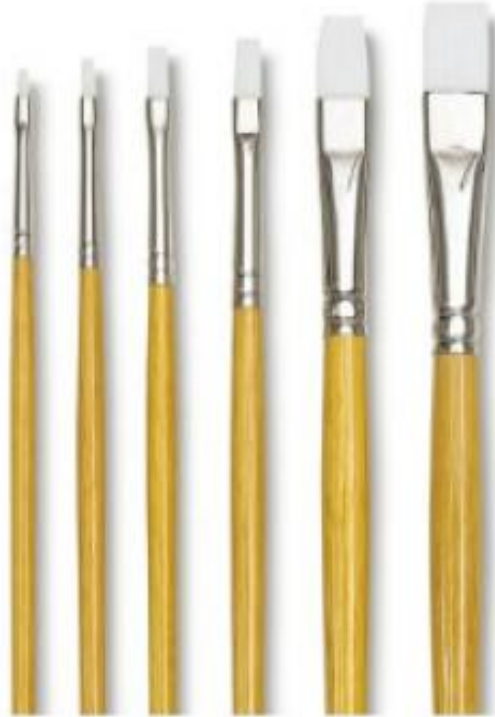
الشكل (٢٤): فرش تستعمل للألوان الزيتية.