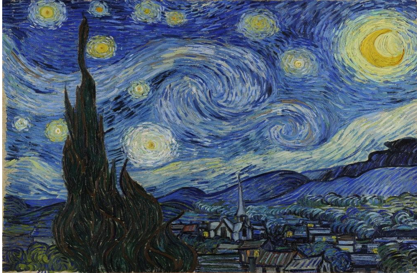
لوحة الليلة المتلألئة الفنان (فان جوخ)