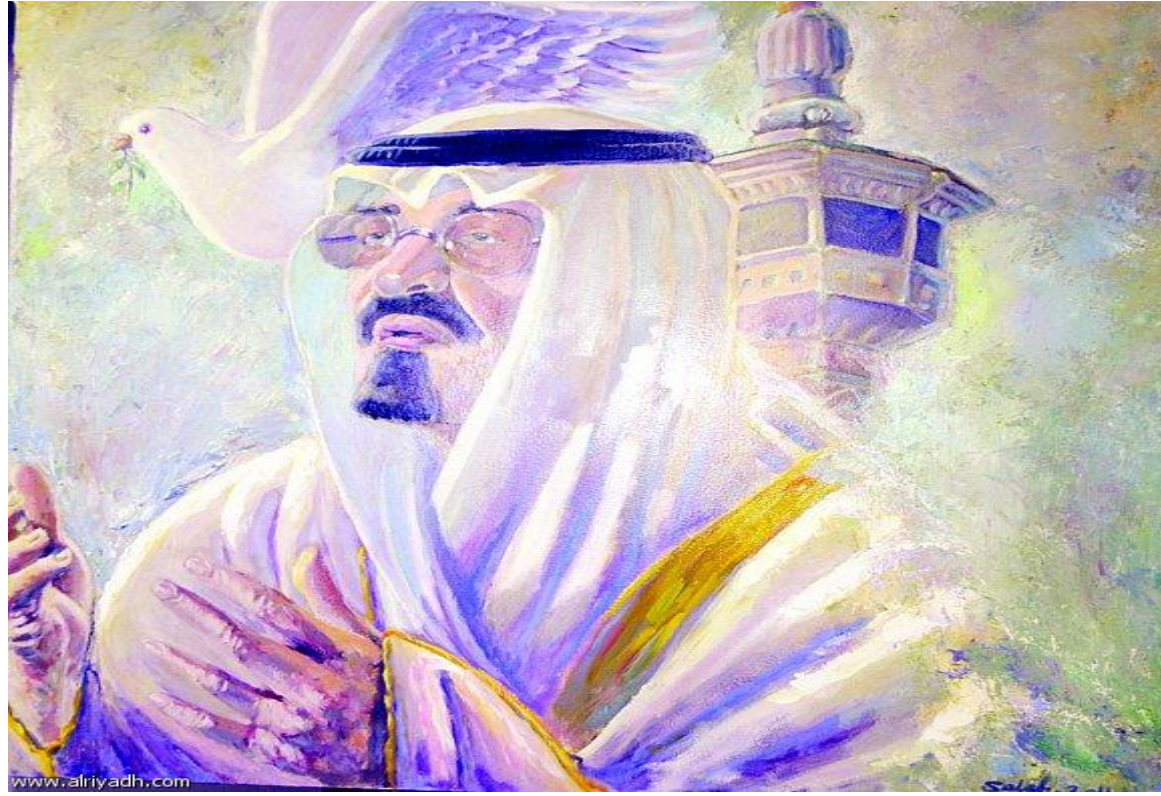
لوحة الملك عبدالله للفنان السعودي (صالح الشهري)