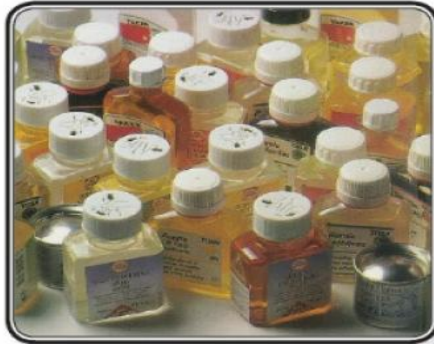
الشكل (٢٧): وسائط زيتية ومذيبات لتخفيف الألوان الزيتية وتنظيف الفرش.