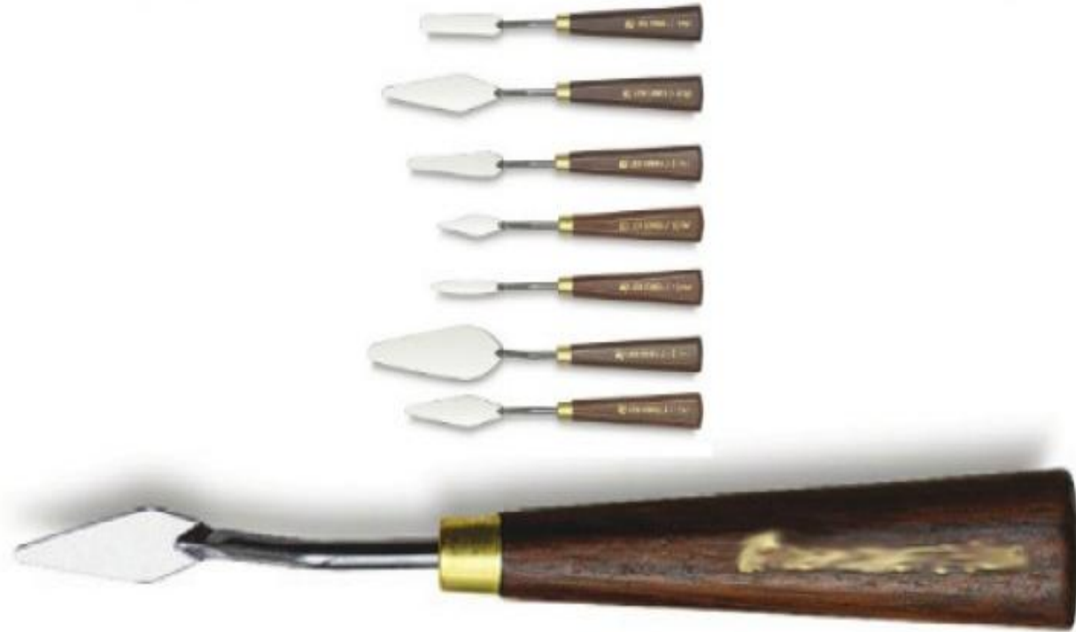
الشكل (٢٦): هي الأعلى/أشكال مختلفة ومتنوعة من سكين الرسم، وفي الأسفل/ سكين الرسم الشائع الاستخدام على قماش الرسم الكانفاس.