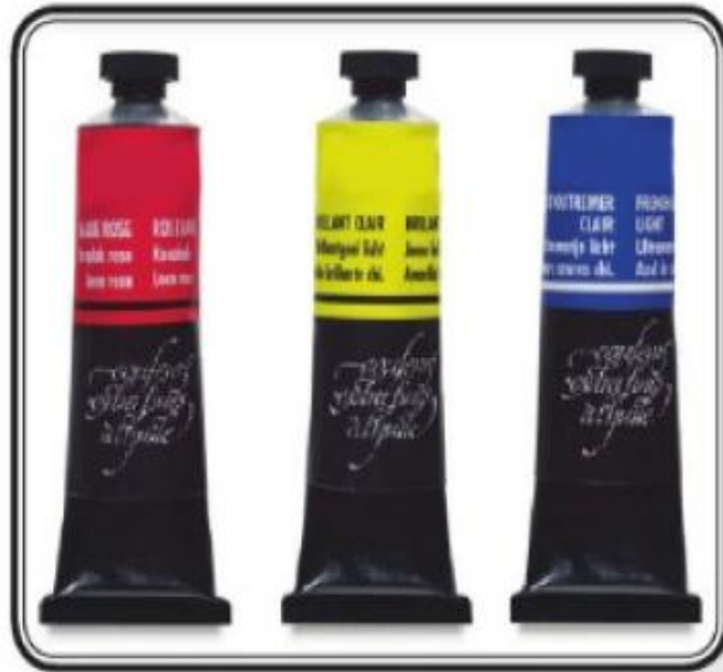
الشكل (٢٣): الألوان الأساسية الثلاثة، بعد مزجها شكلنا منها دائرة الألوان.