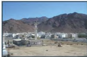
جبل أهد في المدينة المنورة

قامت على أرض المملكة العربية السعودية ممالك وحضارات قديمة، مثل: كِنْدَةَ وِدُومَةَ الجَنْدَل ومَدْيَن. كما شهدت مكة المكرمة مبعث خاتم الأنبياء وأشرف المرسلين محمد بن عبدالله ﷺ، وتأسيس الدولة في العهد النبوي وعاصمتها المدينة المنورة، التي نشرت الإسلام في أرجاء شبه الجزيرة العربية، ثم إلى سائر بقاع العالم، وشهدت أيضاً أحداث عهد الخلفاء الراشدين.