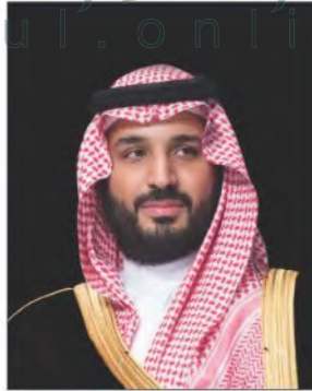
الأمير محمد بن سلمان بن عبدالعزيز آل سعود ولي العهد، نائب رئيس مجلس الوزراء، وزير الدفاع

وهذا من أهم مقومات المملكة العربية السعودية من حيث أساسها السياسي المستقر القائم على مبادئ إسلامية، وتاريخها العريق الأصيل على أرض شبه الجزيرة العربية، وكذلك اعتماد النظام الملكي على البيعة، وهو مبدأ إسلامي أصيل، يؤدي إلى الاستقرار وتحقيق المصالح العامة شرعاً ومصدراً.