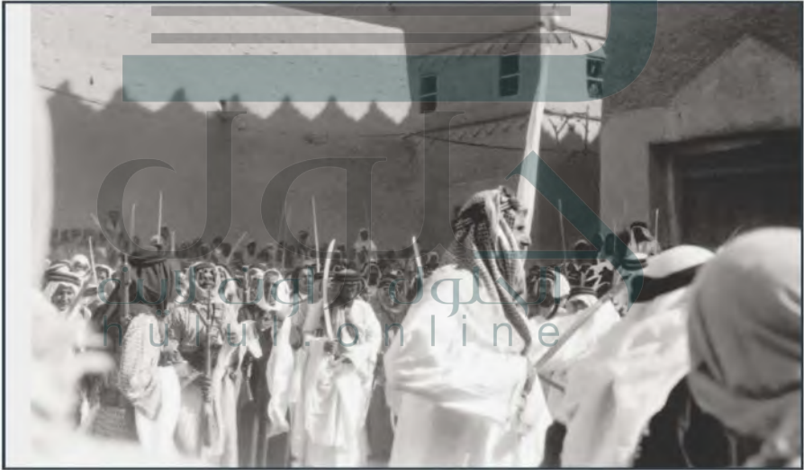
⚠️ الملك عبدالعزيز وهو يؤدي العريضة مع المواطنين عام ١٣٧٠هـ/١٩٥٠م

ويقوم المجتمع السعودي على أساس من اعتصام أفراده بحبل الله، وتعاونهم على البر والتقوى، والتكافل بينهم، واجتناب تفرقهم، وتعزيز الوحدة الوطنية في النفوس، وتمنع الدولة كل ما يؤدي إلى الفرقة والفتنة والانقسام.