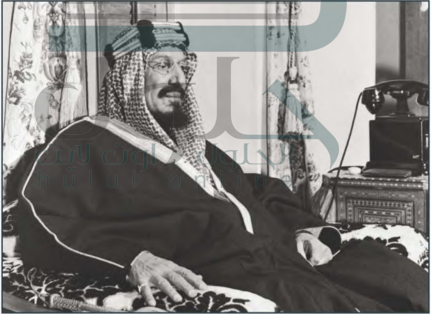
الملك عبدالعزيز بن عبدالرحمن آل سعود

ولهذا تؤدي المملكة العربية السعودية دوراً سياسياً فاعلاً، يُمكنها من إرساء علاقات وطيدة بين جيرانها من الدول العربية، ومع غيرها من الدول الأخرى، ومن حلّ الخلافات التي قد تنشأ بين الدول العربية والإسلامية، ولها مواقف كثيرة في مساندة هذه الدول في قضاياها، وتقديم الدعم الكامل لها. وللمملكة العربية السعودية علاقات تعاون مع الدول الصديقة، وتحظى باحترام وتقدير متبادل معها، كما أن لها دوراً فاعلاً في القرارات الدولية، وهي عضو في كثير من الهيئات الدولية، ومن الأعضاء المؤسسين لهيئة الأمم المتحدة عام ١٣٦٤هـ / ١٩٤٥م.