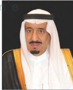
الملك سلمان بن عبدالعزيز آل سعود ملك المملكة العربية السعودية