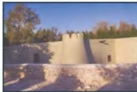
مسجد جَوَانَا بالقرب من مدينة الهغوف بالأحساء