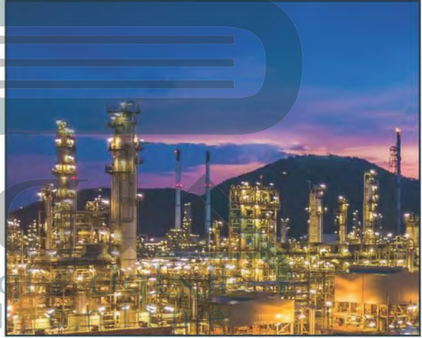
شركة أرامكو السعودية

تحتل المملكة العربية السعودية بمكانة اقتصادية متقدمة بين دول العالم، فهي تقع على عدد من المنافذ البحرية المهمة، وهي من أكبر الدول إنتاجاً للنفط وتصديراً له، وتمتلك احتياطياً نفطياً هائلاً، جعلها من الدول القيادية الفاعلة في منظمة (أوبك)، وهي أيضاً من كبريات الدول المنتجة للغاز الطبيعي، وتمتلك كثيراً من المعادن المختلفة.