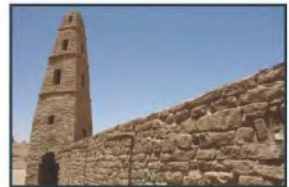
مسجد عمر بن الخطاب في دُومَة الجندل