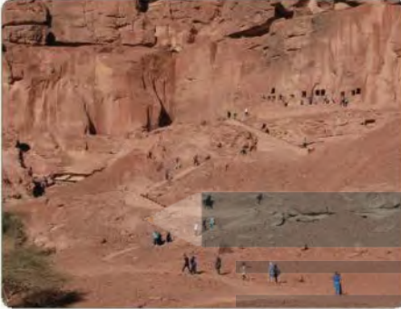
آثار لحيانية في الحُرَيبة بالعلّاء

نشأت مملكة دادان في العُلا في شمال غربي المملكة العربية السعودية في القرن السادس قبل الميلاد في مركز مهم ورئيس على طريق التجارة المتجه من شبه الجزيرة العربية إلى الشمال نحو العراق والشام ومصر. وتدل النقوش والمكتشفات الأثرية في الحُرَيبة بالعلّاء والجبال المحيطة بها على تفاعل هذه المملكة مع محيطها، وعلى حضارتها الواسعة. ثم تحولت مملكة دادان إلى مملكة لحيان في الموضع نفسه، وواصلت عطاءها الحضاري في المنطقة. وتتميز المنطقة بشواهد أثرية غنية تدل على الحضارة الكبيرة لهذه المملكة، مثل: صناعة الفخار، والواجهات الضخمة للمقابر، والمنحوتات والنقوش. وبنهاية القرن الأول قبل الميلاد انتهت مملكة دادان ولحيان.