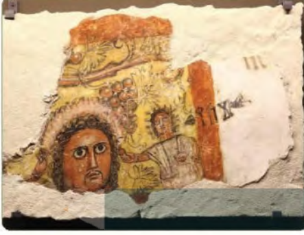
لوحة جدارية من الفاو

ويتميز موقع مدائن صالح بشواهد أثرية عظيمة تتمثل في المقابر المنحوتة في الجبال بأسلوب معماري فريد من نوعه. امتد حكم الأنباط في شبه الجزيرة العربية من القرن الرابع قبل الميلاد حتى سنة ١١٧م. ونزل فيهم قول الله تعالى: ﴿وَلَقَدْ كَذَّبَ أَصْحَابُ الْحِجْرِ الْمُرْسَلِينَ ﴿٨٠﴾ وَءَاتَيْنَاهُمْ آيَاتِنَا فَكَانُوا عَنْهَا مُعْرِضِينَ ﴿٨١﴾ وَكَانُوا يُنْحِتُونَ مِنَ الْجِبَالِ بُيُوتًا مَّوْبِنِينَ ﴿٨٢﴾ فَأَخَذْتَهُمُ الصَّيْحَةُ مُصْبِحِينَ ﴿٨٣﴾ فَمَا أَغْنَىٰ عَنْهُمْ مَا كَانُوا يَكْسِبُونَ ﴿٨٤﴾﴾ [الحجر: ٨٠-٨٤].