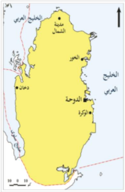
شكل (1) خريطة دولة قطر

وتشمل الموقع الجغرافي لدولة قطر وما يتضمنه من مميزات طبيعية، وموارد متعددة، وحياة طبيعية متنوعة: مما ينعكس على هوية المجتمع وتشكيله.