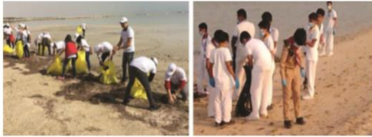
مركز أصدقاء البيئة ينظم حملة تنظيف لإحدى شواطئ قطر

هو الجهد الذي يبذله الإنسان تجاه المجتمع بدون مقابل مادي.