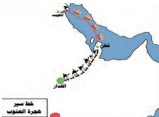
هجرة آل الصباح