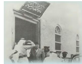
أول مدرسة (مدرسة المباركية)