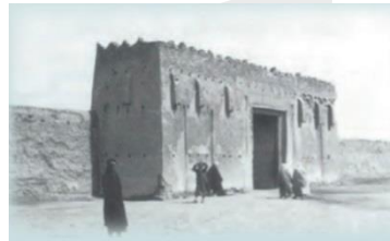
سور الكويت الثالث