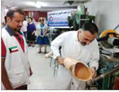
تركيب الأطراف الصناعية