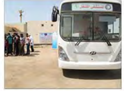
مستشفى متنقل لجرحي الحروب