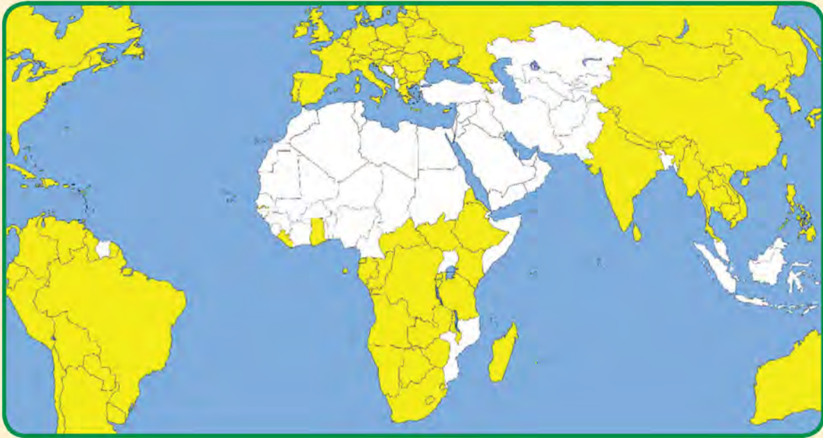
شكل (٣٠) خريطة صماء لدول العالم الإسلامي

توجد دول إسلامية تصل نسبة التصحر فيها ما بين ١٠ - ٥٠٪ ، ومنها لبنان وسوريا والسودان والعراق والسنغال غرباً حتى الصومال شرقاً . قم بتحديد مواقع هذه الدول على الخريطة التالية بالاستعانة بالأطلس المدرسي .