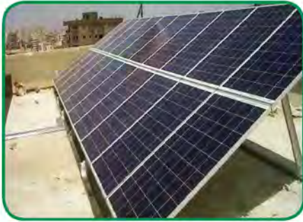
شكل (٣٢) صورة الطاقة الشمسية كطاقة بديلة نظيفة للبيئة

الكويت : أعلنت دولة الكويت عن خطط لتوليد ١٥٪ من احتياجاتها من الطاقة من خلال المصادر المتجددة بحلول عام ٢٠٣٠ . وبحلول عام ٢٠١٧ تم تشغيل أول محطة كهرباء تعمل بالطاقة الشمسية . ومن المتوقع اكتمال مشروع رائد لإنتاج ٧٠ ميغاوات من الكهرباء في منطقة الشقاييا في غرب الكويت .