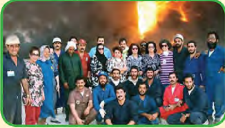
شكل رقم (٤٥) توضح فريق مكافحة الحرائق الكويتي في ٩ سبتمبر ١٩٩١م