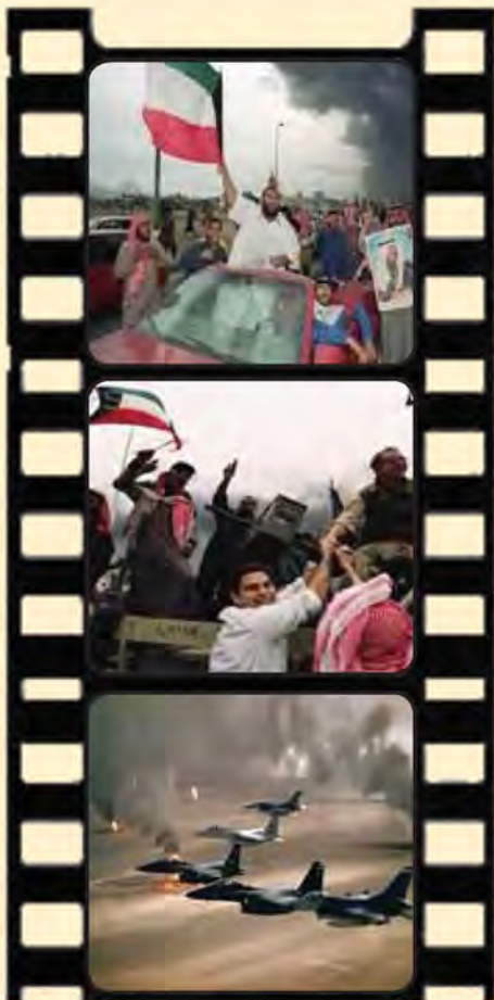
شكل رقم (٣٥) توضح الحرب الجوية وفرحة التحرير

قرار رقم ٦٧٨ - ٢٩ نوفمبر ١٩٩٠ ، إن مجلس الأمن إذ يشير إلى ، ويعيد تأكيد قراراته ٦٦٠ ، ٦٦١ ، ٦٦٢ ، ٦٦٣ ، ٦٦٤ ، ٦٦٥ ، ٦٦٦ ، ٦٦٧ ، ٦٦٨ ، ٦٦٩ ، ٦٧٠ ، ٦٧٤ ، لعام ١٩٩٠ ، وإذ يلاحظ ، رغم كل ما تبذله الأمم المتحدة من جهود ، أن العراق يرفض الوفاء بالتزامه بتنفيذ القرار ٦٦٠ ، والقرارات اللاحقة ، ذات الصلة.المشار إليها أعلاه ، مستخفاً بمجلس الأمن ، استخفافاً صارخاً (انسحاب القوات العراقية)