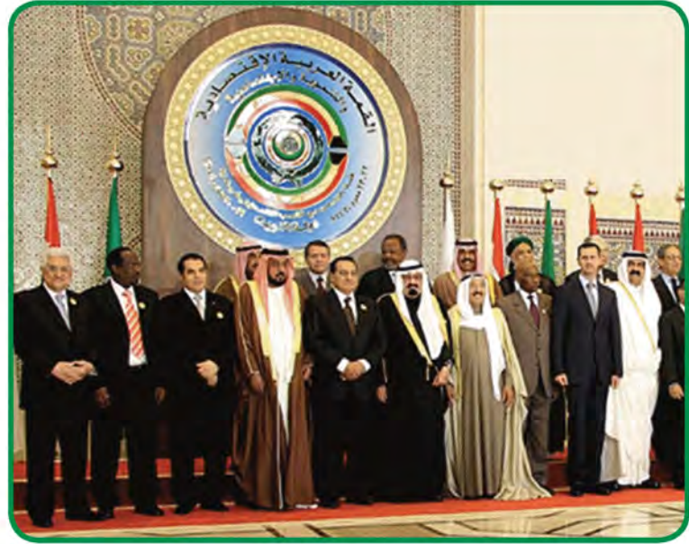
شكل رقم (٣٦) مؤتمر القمة العربية الاقتصادية والتنموية والاجتماعية في الكويت ٢٠٠٩م