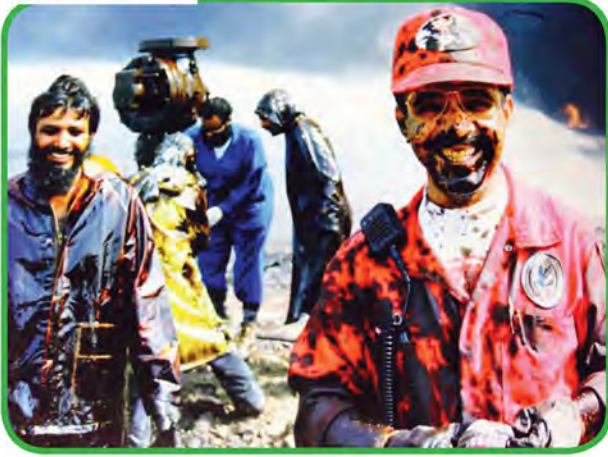
شكل رقم (٤٧) توضح فريق الأطفاء أثناء بذله وجهوده وعطاءه في إطفاء حرائق الآبار