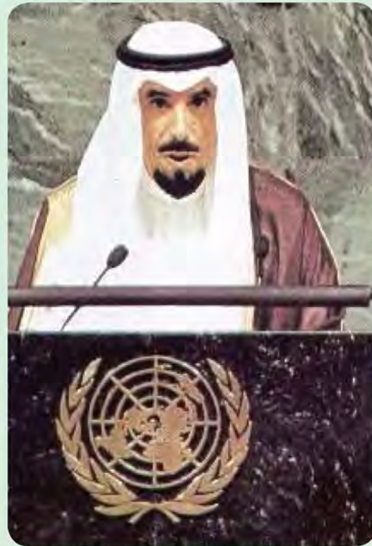
شكل رقم (٣٤) الشيخ جابر الأحمد الصباح في منصبه الأمم المتحدة وخطابه الحكيم الذي حرك العالم تجاه قضية دولة الكويت .