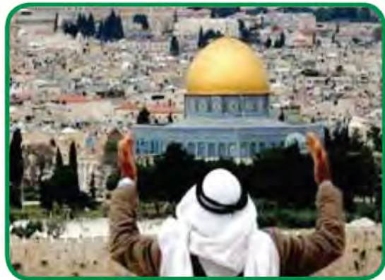
شكل رقم (٤٠) توضح الانتفاضة الفلسطينية