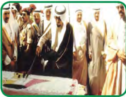
شكل رقم (٥٠) توضح الشيخ جابر الأحمد الصباح - رحمه الله - والشيخ سعد العبدالله - رحمه الله - ولقطة احتفال بإطفاء آخر بئر