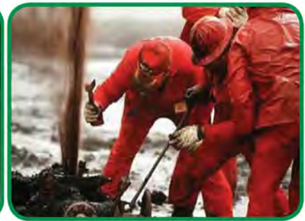
شكل رقم (٤٩) تكاتف جهود الفرق الكويتية والأجنبية في إطفاء آبار النفط