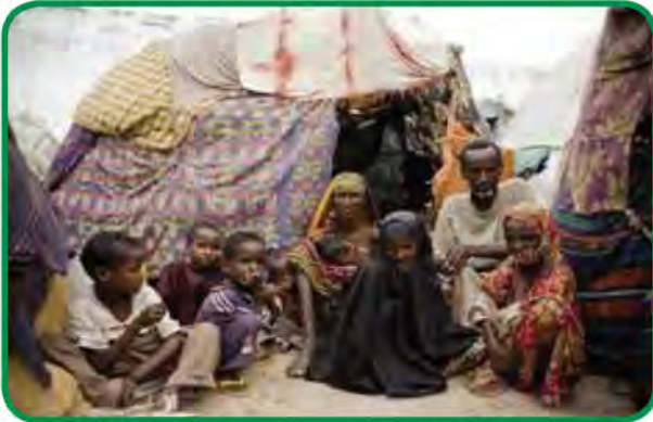
شكل رقم (٤٢) تشرد آلاف السكان جراء الحرب الأهلية

من أقوال السكرتير العام للأمم المتحدة أنطونيو جوتيريش تجاه أزمة الصومال : «الناس تموت هنا ، ويجب على العالم أن يتحرك الآن لوقف هذا» ، واصفاً وجود الصراعات والجفاف وتغير المناخ والمرض ووباء الكوليرا في مكان واحد بالكابوس .