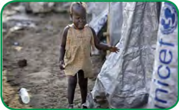
شكل رقم (٤٣) انتشار الجوع والأمراض