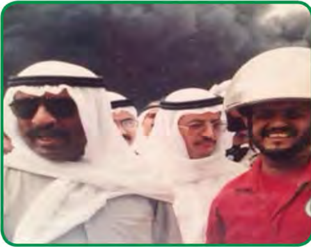
شكل رقم (٤٨) توضح ولي العهد الشيخ سعد العبدالله - رحمه الله - ووزير النفط الدكتور حمود الرقبة متفقدين حقول الآبار النفطية