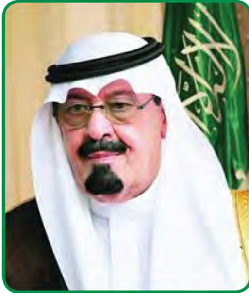
شكل رقم (٣٧) الملك عبدالله بن عبد العزيز رحمه الله