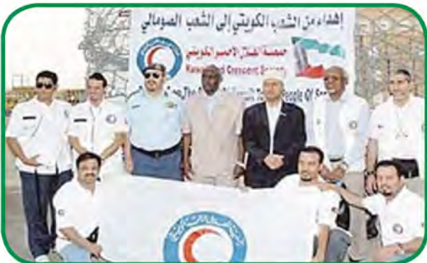
شكل رقم (٤٤) مساعدات دولة الكويت الإنسانية للصومال

ابحث عن دور منظمة التعاون الإسلامي (مؤتمر التعاون الإسلامي) .