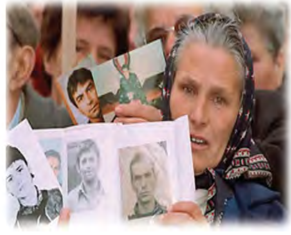
شكل رقم (٤١) توضح معاناة شعب البوسنة والهرسك