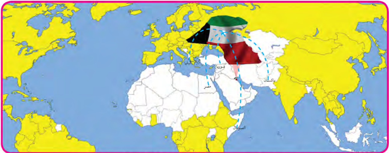
خريطة (٥٧) توضح مساعدات دولة الكويت الإنسانية لبعض الدول الإسلامية

حرصت دولة الكويت منذ استقلالها وعبر تاريخها الحافل بالعطاء على تقديم المساعدات الإنسانية لكافة دول العالم عبر نشاطات وإسهامات متميزة في قطاعات متعددة للفئات المتضررة من جراء الكوارث والأزمات الطبيعية ، وغير الطبيعية ، وذلك دون تمييز لدين أو لون أو عرق حتى اعتبر العمل الإنساني سمة من سماتها ورافداً من روافد العمل السياسي والاقتصادي الخارجي لها ، وقامت دولة الكويت عبر تاريخها الحافل بالعطاءات الإنسانية بالعديد من المبادرات والمواقف الإنسانية في مجالات البناء والتنمية والاستثمار ودعم البحث العلمي مما شكل نموذجاً إنسانياً فريداً يقوم على تسويق سياسة السلم والأمن الدوليين من خلال تقديم المساعدات الإنمائية والإغاثية ، حيث اعتمدت منذ استقلالها عام ١٩٦١ على عدة قنوات حكومية وأهلية تم إنشاؤها على مدى خمسين عاماً .