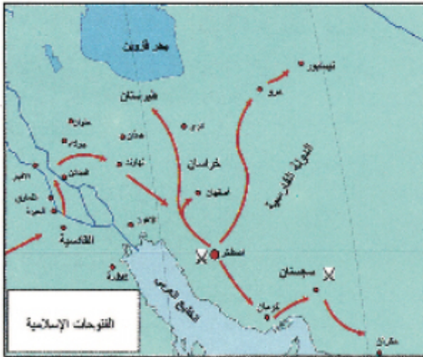
شكل (٢٢) خريطة الفتوحات الإسلامية في الشرق

عمر بن الخطاب قد نلم في الإسلام ثلثة يجب أن ينهزوها وهم متجاهلون أن الله سبحانه وتعالى قد وعد جنده بالنصر الساحق لقوته تعالى: ﴿وَإِنَّ جُنُدًا طُمَّ الْعَيْنُونَ﴾ سورة الصافات: آية (١٧٣). ولكن عثمان بن عفان صمد أمام هذه الأحقاد بكل عزم وإيمان وبدأ بالتوسع الإسلامي لاستكمال مسيرة نشر الرسالة المحمدية ورفع صوت الإيمان والوحدانية.