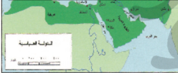
شكل (٢٨) الدولة العباسية

جماعة الخوارج كانوا يؤمنون بالولاية كأساس لنظام الحكم، ولا يرون حصر الخلافة في جنس معين أو بيت معين، بل يعتقدون أن الخلافة للأمة بأكملها الاختيار فيها هو الأساس، كما أعلنوا خصيتهم واثمنوا زعمهم من شهور الحكم ومطامعهم، لهذا كانت هذه الجماعة معارضة للخلف الأموي، وقد اشترك أفرادها في الفتنة التي قامت ضد الدولة الأموية، كما انتشر عدد كبير منهم في المناطق البعيدة عن مركز الخلافة بمشقة