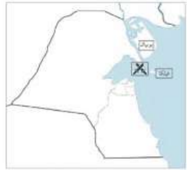
شكل رقم (11) معركة الرقة البحرية

به تبرير هجومهم على الكويت من خلاله. وتعدّ معركة الرقة التي جرت بين الكويت وبين بني كعب أول معركة بحرية في تاريخ الإمارة، وأول امتحان حقيقي لقوة الكويت وقدرتها على الدفاع عن نفسها، خاصة أن الخطر جاء بحرّيّاً، فاستطاع الكويتيون إثبات قدرتهم أمام قوة بحرية كبيرة كتقوة بني كعب، والذين كانوا يمتلكون أحد أكبر الأساطيل وأقواها بشمال الخليج في هذه الفترة، حيث عاد الكويتيون بعد المعركة بالكثير من الذخيرة والمدافع التي غنموها ونصبوها على الشاطئ، تحليفاً لانتصارهم.