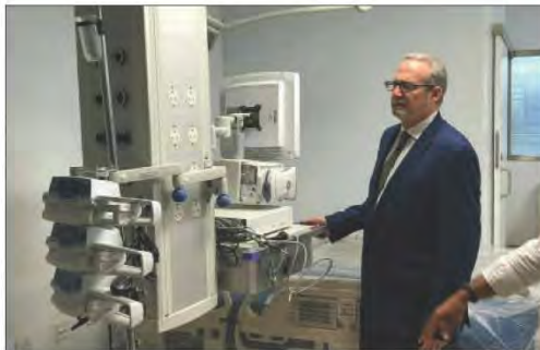
شكل رقم (٨٢)

التقاء وزير الدفاع البريطاني مايكل فالون بوزير الدفاع الكويتي الشيخ ناصر الصباح بهدف تعزيز التعاون العسكري بين المملكة المتحدة ودولة الكويت