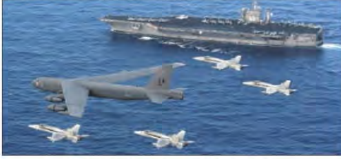
شكل رقم (٨٣) استخدام القوة السياسية