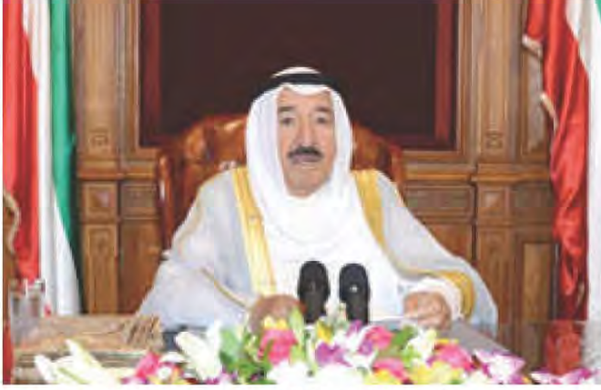
خطاب سمو أمير البلاد يقوم بزيارة إلى مبنى وزارة الخارجية - الكويت بتاريخ ٢٧ مايو ٢٠١٨

«... التعاون بين دول وشعوب العالم لبناء مصالح مشتركة قائمة على مبادئ لا تحيد عنها هي عدم التدخل في شؤون الآخرين والحفاظ على حسن الجوار والتمسك بقواعد الشرعية الدولية وأسس القانون الدولي وصولاً إلى الحفاظ على الأمن والسلام الدوليين والسعي دوماً لمزيد العون للدول وتقديم المساعدات