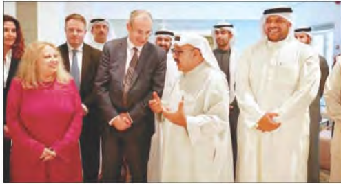
شكل رقم (٨١)

التقاء السفير الأسترالي جيلبرت بمدير عام معهد الكويت للأبحاث العلمية لمناقشة سبل التعاون العلمي والبحثي لتحقيق رؤية الكويت لعام ٢٠٣٥م