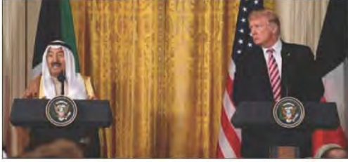
شكل رقم (٨٤) الدبلوماسية