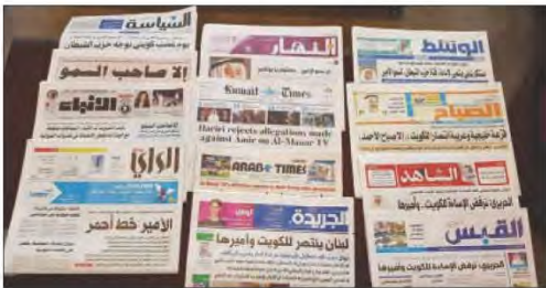
شكل رقم (٨٦) استخدام وسائل الإعلام