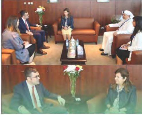
شكل رقم (٨٠)

التقاء السفير الأسترالي جيلبرت بمدير عام معهد الكويت للأبحاث العلمية لمناقشة سبل التعاون العلمي والبحثي لتحقيق رؤية الكويت لعام ٢٠٣٥م