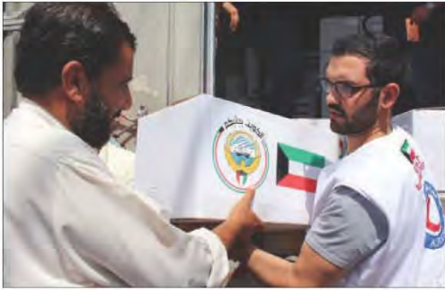
شكل رقم (٨٥) المعونات الخارجية