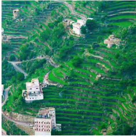
شكل (٥٣) الزراعة على المدرجات الجبلية في اليمن

نشاط (١) للتعرف أكثر على توزيع الكثافة السكانية اقرأ النص ، ثم ساعد خالدًا في الإجابة عن تساؤلاته :