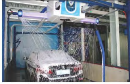
غسيل السيارات بالنظام الآلي

تشير إحصائيات وتقارير المنظمات العالمية إلى أن هنالك حوالي ٢٠٠ مهنة ستشهد انخفاضاً في معدلات العمالة في فترة أقل من عشرين سنة، وستصبح في قائمة المهن المهددة بالانقراض ومن المتوقع أن تشهد مهن الزراعة وصيد الأسماك والتصنيع والخدمات العامة تراجعاً كبيراً في عدد الوظائف المتاحة، وذلك نتيجة لسيطرة التكنولوجيا من أبرزها الذكاء الاصطناعي والذي تمثل في الروبوتات (ربوت) التي تحل محل الأيدي العاملة والتي ستسبب البطالة .