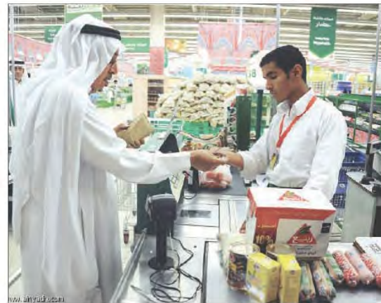
شكل رقم (١٠٤) الكاشير التقليدي