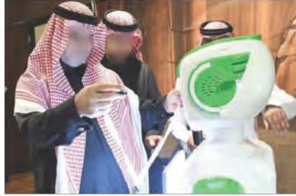
شكل رقم (١٠٢) الروبوت