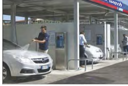
شكل رقم (١٠١) غسيل السيارات بالطريقة التقليدية