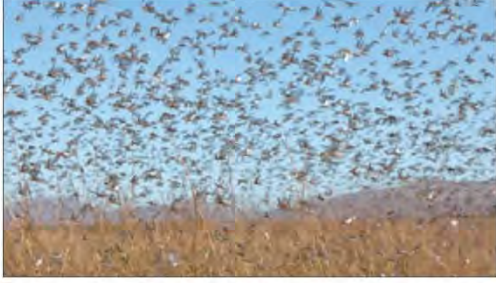
صورة رقم (١٠٠) توضح غزو الجراد على المزارع