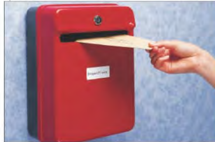
شكل رقم (١٠٣) البريد التقليدي

التكنولوجيا: تعني الطرق المادية المستعملة في صناعة الأشياء وعملها.