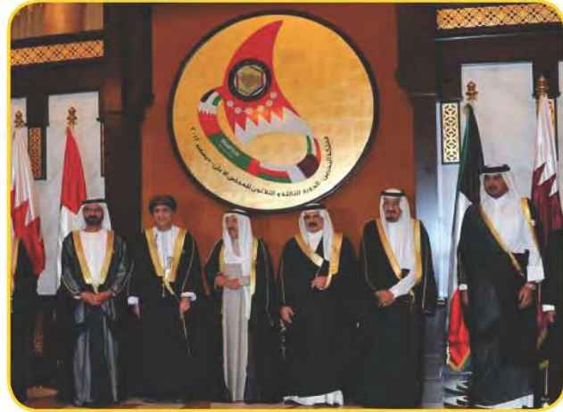
شكل (١٠٥) قادة دول مجلس التعاون الخليجي