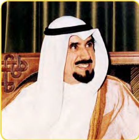
شكل (١٠٨) صاحب السمو الراحل الشيخ / جابر الأحمد الصباح

يُعدُّ الصندوق الكويتي للتنمية الاقتصادية العربية أول مؤسسة للتنمية في الوطن العربي ، حيث يقوم بالمساهمة في تحقيق مشاريع التنمية الضرورية الخاصة بالمجالات الصحية والاجتماعية ، وكذلك تقديم المساعدات اللازمة في حالات الكوارث والنكبات ودعم قضايا الأمة العربية الإسلامية .