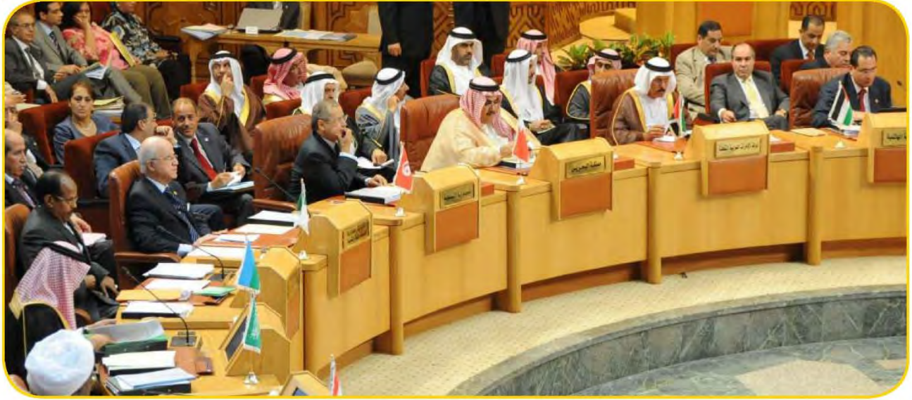
شكل (١٠٠) اجتماع وزراء الخارجية العرب

التضامن العربي: هو العمل على توثيق الصلات بين الدول والشعوب العربية ، وحماية مصالحها السياسية والاقتصادية والثقافية .