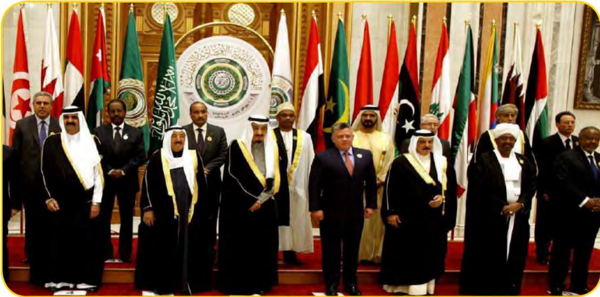
شكل (٩٥) صورة توضح التعاون العربي

حققت الدول العربية خلال العقود الثلاثة الماضية إنجازات عديدة في مجالات التنمية الاقتصادية والاجتماعية والبشرية ، هذه التنمية انطلقت من التعاون بين الدول العربية كوسيلة لمواجهة التحديات وتحقيق الطموحات .