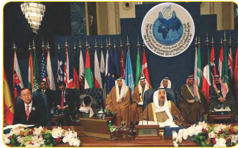
شكل (١١٠) كلمة صاحب السمو أمير البلاد الشيخ صباح الأحمد الجابر الصباح -حفظه الله ورعاه- في افتتاح المؤتمر.