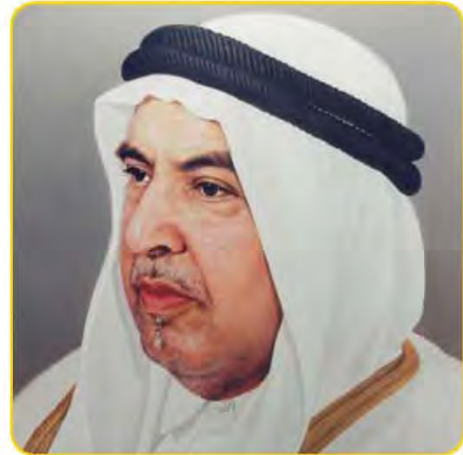
شكل (١٠٧) صاحب السمو الراحل الشيخ / عبد الله السالم الصباح