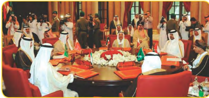
شكل (١٠٦) اجتماعات قادة دول مجلس التعاون الخليجي