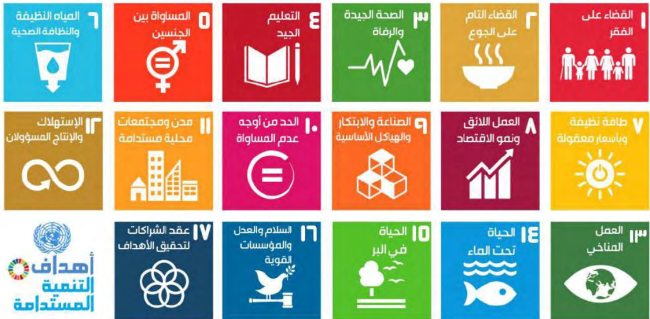
شكل ( ٩٩ ) أهداف التنمية المستدامة