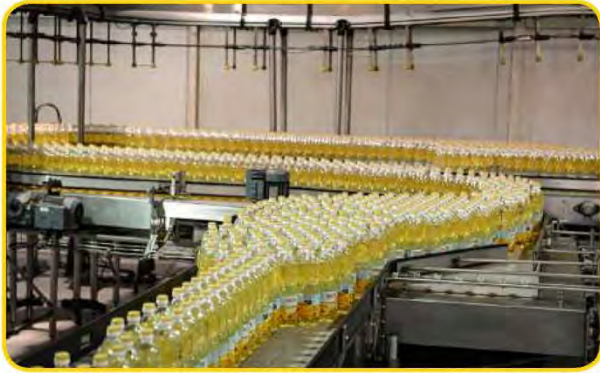
شكل (٩٧) صناعة الزيوت النباتية في المملكة المغربية