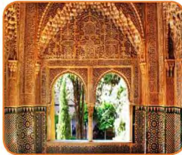
شكل (٤٧) قصر الحمراء