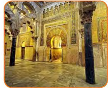
شكل (٤٦) مسجد قرطبة