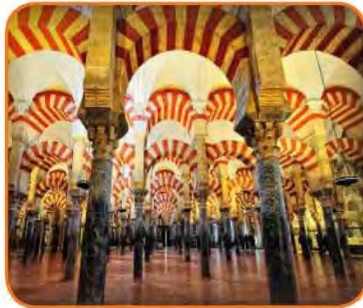
شكل (٤٨) جامع المنصور

أشكال توضح الجانب المعماري من الحضارة الإسلامية التي برع فيها العرب المسلمون