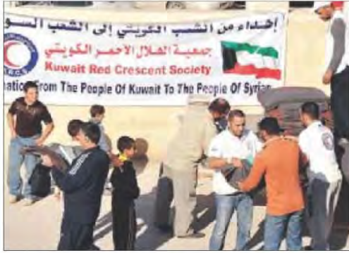
شكل رقم (١٤٣)