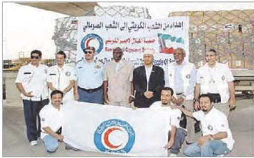
شكل رقم (١٤٤)

للكويت دور كبير في أعمال الخير وتقديم المساعدات لمن يحتاجها، حيث أنشئت العديد من المؤسسات والجمعيات الخيرية بهدف مساعدة الفقراء والمحتاجين في جميع أنحاء العالم. وتعد الكويت أحد النجوم اللامعة في سماء النشاط الخيري منذ القدم.