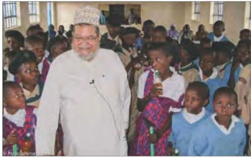
شكل رقم (١٤٦)