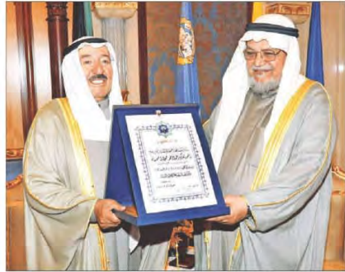
شكل رقم (١٤٧)

عدد المسلمين الذين أسلموا على يد الدكتور عبدالرحمن السميط أكثر من ١١ مليون شخص، بعد أن قضى أكثر من ٢٩ سنة ينشر الإسلام في القارة السمراء (قارة أفريقيا).