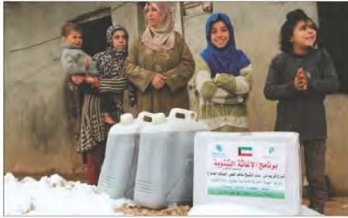
شكل رقم (١٤٩)