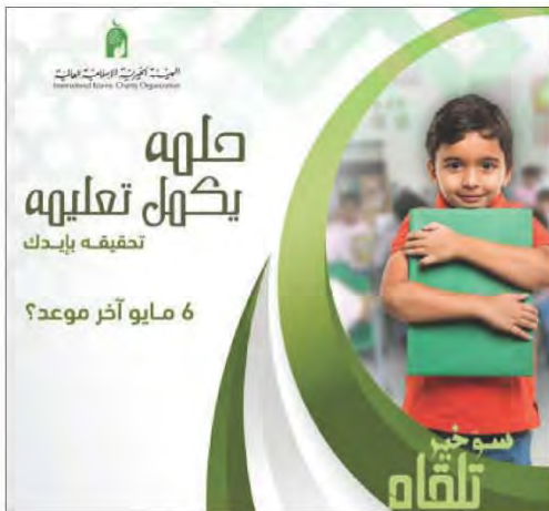
شكل رقم (١٥٠)