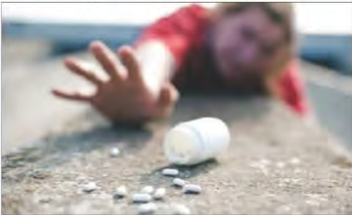
شكل رقم (١٠٧) تأثير المخدرات