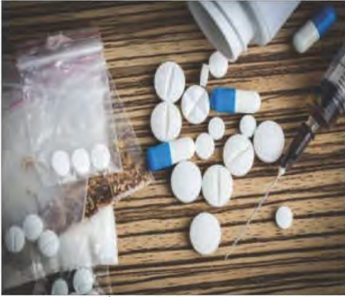
شكل رقم (١٠٥) المخدرات وأدواتها

عرفت منظمة الصحة العالمية الإدمان على أنه: «حالة نفسية وأحياناً عضوية تنتج من التفاعل مع العقار».