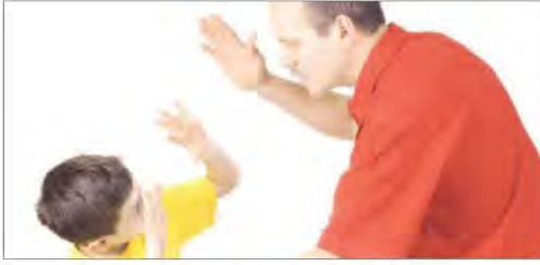
شكل رقم (١٠٨) العنف ضد الطفل

إعلان حقوق الطفل يضع في الاعتبار «أن الطفل، بسبب عدم نضجه البدني والعقلي، يحتاج إلى إجراءات وقاية ورعاية خاصة، بما في ذلك حماية قانونية مناسبة، قبل الولادة وبعدها».