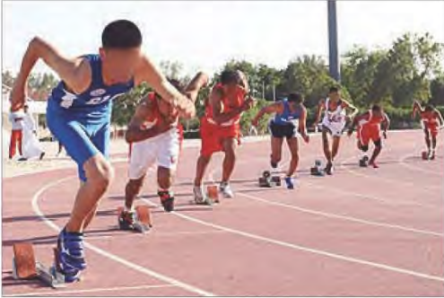
شكل رقم (١٠٦) الطالب الرياضي