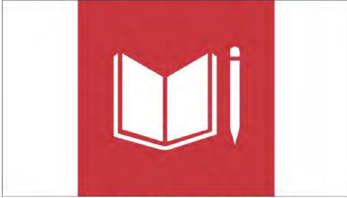
شكل رقم (١٠٩) يمثل شعار التعليم الجيد