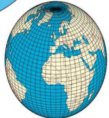
شكل (٥) خريطة توضح خطوط الطول ودوائر العرض