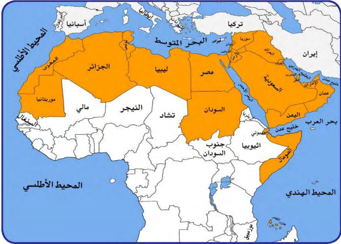
شكل (٦) الخريطة السياسية للوطن العربي