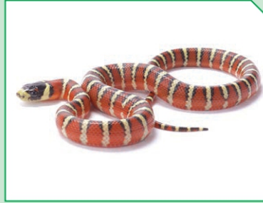
الأفعى الملك (غير سامة)