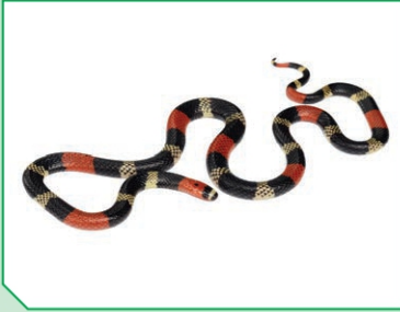
الأفعى المرجانية (سامة)

الجراب تكيف خاص في جسم أنثى الكنغر يساعدها على حماية صغيرها من الخطر.