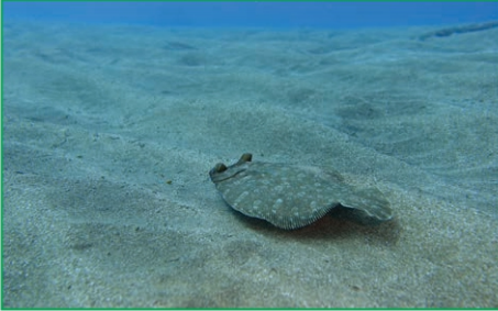
شكل (8): بحر