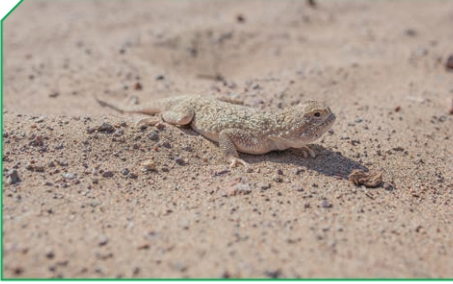
شكل (6): صحراء