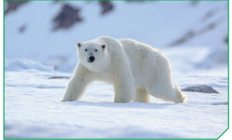
شكل (7): جليد