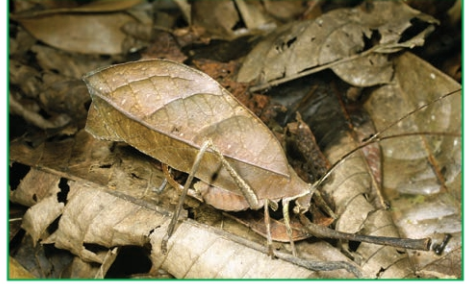
شكل (5): غابة