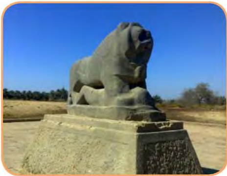
اسم المَعْلَم الحضاري : أسد بابل الحضارة : ... بلاد الرافدين ...

أمامك مجموعة من الآثار لمجموعة من الحضارات في الوطن العربي ، اكتب اسم الحضارة التابعة لها أسفل كل صورة .