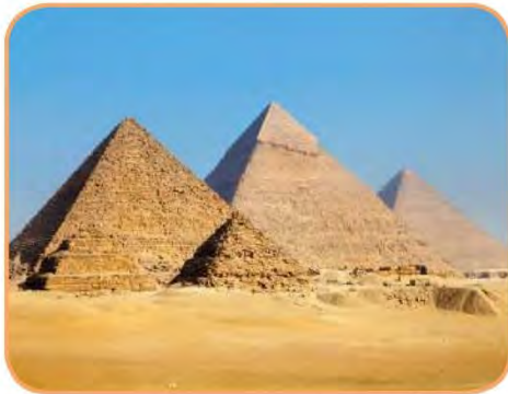
اسم المَعْلَم الحضاري : الأهرامات الحضارة : ... مصر القديمة ...