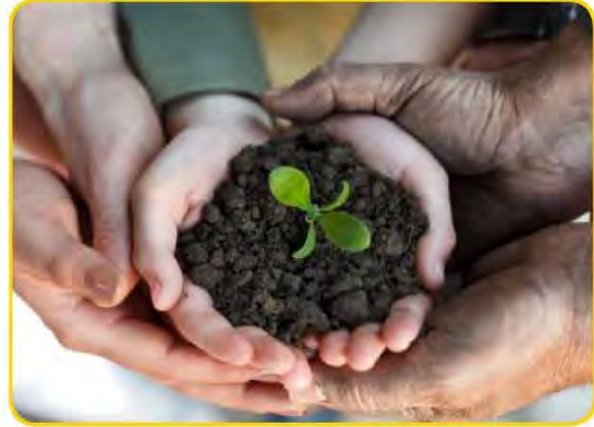
أطفال يغرسون الأشجار