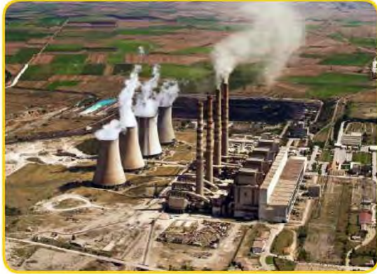
مصنع بعيد عن المناطق السكنية

هل للإنسان دور في المحافظة على التوازن البيئي؟ أجب مستعيناً بالصور التالية :