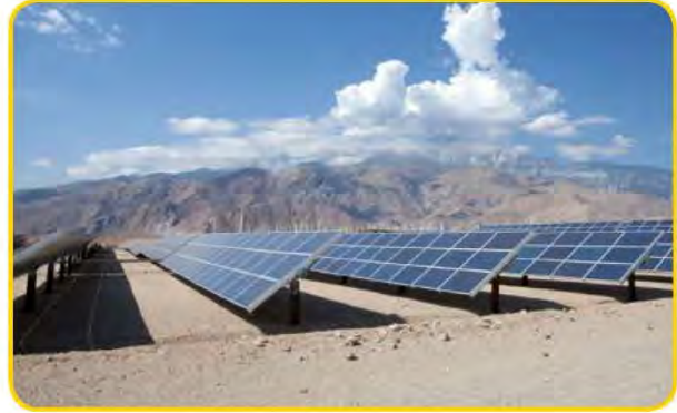
شكل (٩٤) صورة توضح مصادر الطاقة المتجددة الشمس والرياح